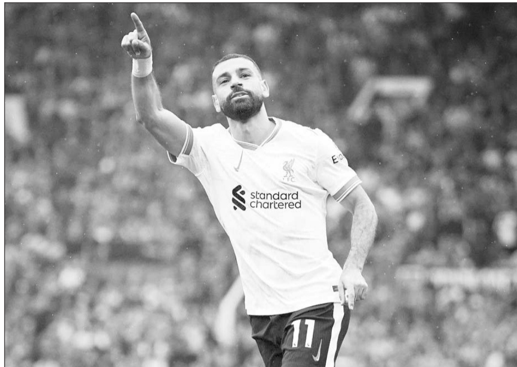
Το συμβόλαιο του Μοχάμεντ Σαλάχ με τη Λίβερπουλ επίσης φτάνει στο τέλος του

Βέβαια, υπάρχουν και οι μνηστήρες εκτός Γερμανίας. Τα σενάρια που τον συνδέουν