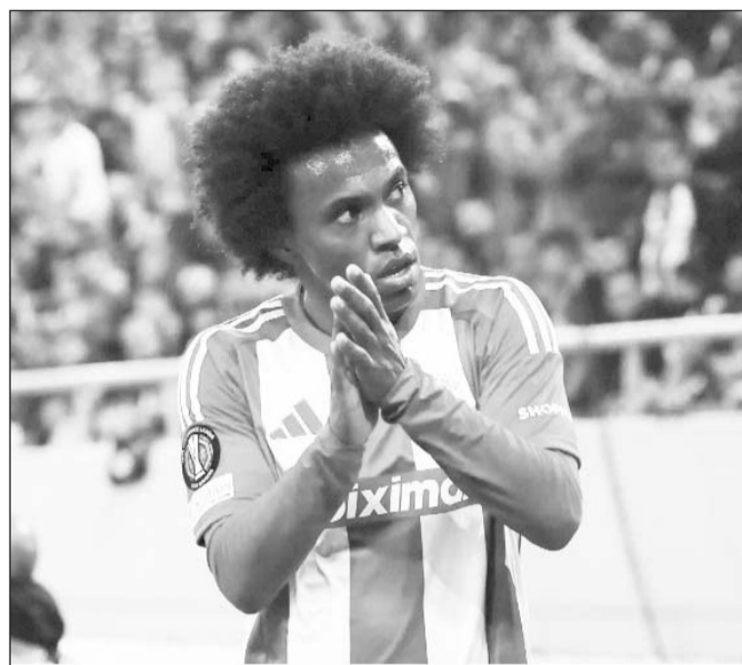
Ο Ολυμπιακός ανακοίνωσε τη λύση της συνεργασίας του με τον Γουίλιαν

Ο Κρίστοφερ Βέλντε ήταν από τα πρόσωπα του τελευταίου μέρους της καλοκαιρινής προετοιμασίας του Ολυμπιακού. Ο Νορβηγός εξτρέμ εντυπωσίασε τους πάντες με την απόδοσή του. Πρόκειται για ένα ποδοσφαιριστή, ο οποίος έχει την ικανότητα να συγκλίνει από τα άκρα και να βρει χώρους για να εκτελέσει