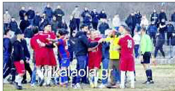
Τέτοιες εικόνες (trikaola.gr) δεν ταιριάζουν στο ερασιτεχνικό ποδόσφαιρο απ' όπου και αν προέρχονται και για οποιονδήποτε λόγο