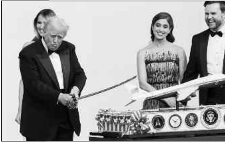
Με τα... μούτρα στην τούρτα!