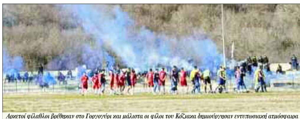
Αρχετοί φίλαθλοι βρέθηκαν στο Γοργογύρι και μάλιστα οι φίλοι του Κόζιακα δημιούργησαν εντυπωσιακή ατμόσφαιρα

Του ΠΑΝΟΥ ΓΙΔΟΠΟΥΛΟΥ gidopoulos@yahoo.gr