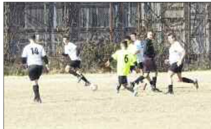
Ο Άγιος Οικουμενίος κέρδισε το Μεγαλοχώρι. Φάση από το παιχνίδι

Ντέρμπι με τα όλα του το ματς, είχε ένταση, νεύρα, μονομαχίες, αποβολή (Γεωργομάνος 37') και κράτησε σε αγωνία τους πολυάριθμους φιλάθλους - πάνω από 300 - που δημιούργησαν καυτή ατμόσφαιρα με τα πολλά καπνογόνα και τις κόρνες, εικόνες ωραίες για