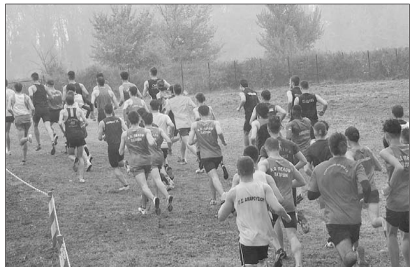
Άκρως ποιοτικό και το Κυριακάτικο ανωμάθου των Σκαμνιών

Και χθες υπεύθυνοι και συνεργεία καταπιάστηκαν με σκηνές και άλλα θέματα.