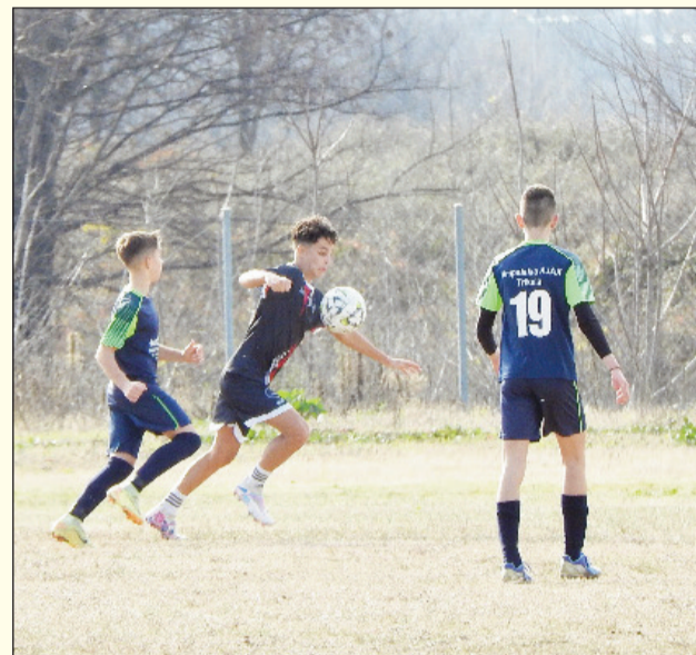
Συνεχίζονται μ' ενδιαφέρον τα πρωταθλήματα υποδομής

Για τους αγώνες υποδομής της ΕΠΣ Τρικάλων θα γίνουν το Σαββατοκύριακο οι παρακάτω αναμετρήσεις: