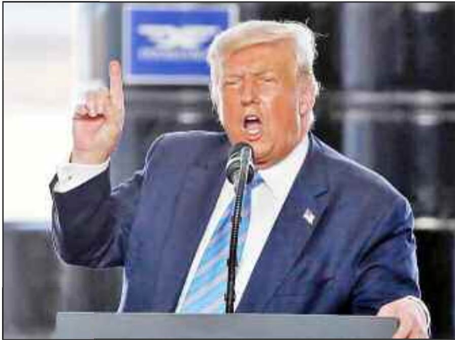
Όποιος φωνάζει δεν σημαίνει ότι έχει και δίκαιο