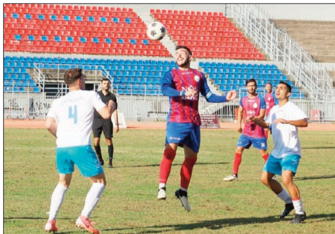
Μόνο για την νίκη θα παίξει αύριο ο Α.Ο Τρίκαλα

ΑΟ Τρίκαλα (Νίκος Μανούρας): Γκέκας, Σκούπρας, Σινγκ, Καρατάσιος (8' λ.τρ. Κατσαντώνης), Γιάννης Σκόνδρας, Κωστόπουλος (58' Αμπντελά), Ισακίδης (58' Βλιώρας), Σαμαντάς (80' Πατρώ-