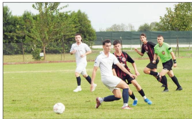
Λυγαριά και Φήκη θα παλέψουν για το τρίποντο σ' ένα αμφίροπο παιχνίδι

Τα ίδια ισχύουν και στο παιχνίδι Κρύα Βρύση - Πρίνος. Οι γηπεδούχοι θέλουν πάση θυσία το τρίποντο για να πάρουν βαθμολογική ανάσα, ενώ