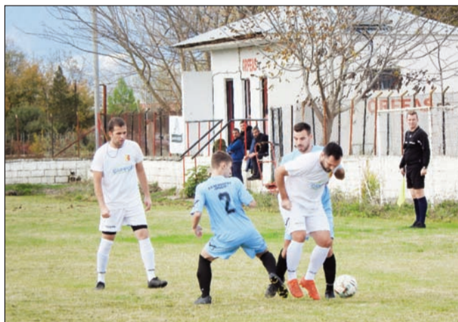
Δύσκολα παιχνίδια περιλαμβάνει το αυριανό πρόγραμμα για τις ομάδες του Β' Ομίλου

Γηπ. Οικουμενίου: Οικουμενίος- Αγ. Μονή 3-0 α.α ΡΕΠΟ: ΑΕΚ Σαραγίων