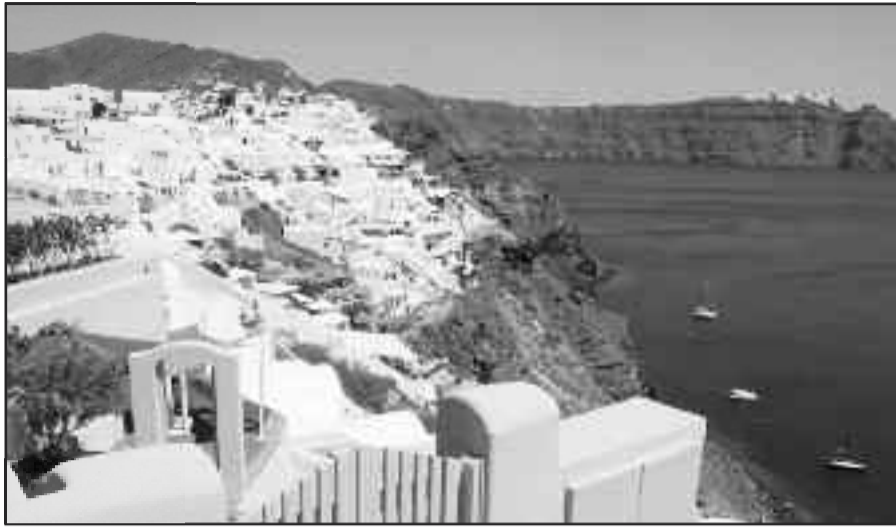
Η σκέψη όλων στην Σαντορίνη