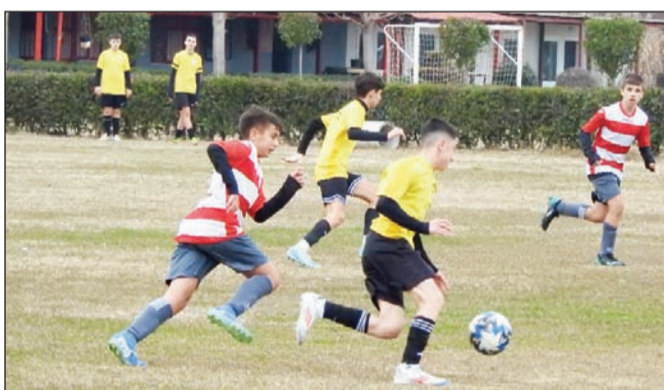
Τα τμήματα υποδομής συνεχίζουν την προσπάθειά τους