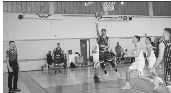
Ελκυστικά παιχνίδια και στον νέο κύκλο Α1 ΕΣΚΑΘ

Στις τάξεις των ομάδων μας σήμανε συναγερμός αφού καλούνται να αντιμετωπίσουν στην 17η αγωνιστική συγκροτήματα διαφορετικών σχολών.