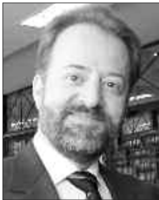
Επιμέλεια: Λευτέρης Σαββουλίδης Θεολόγος Α. Π. Θ. Anatolikathsorthodoxias.blog spot.com

Θεόδωρος, αρνήθηκε ευγενικά, επικαλούμενος λόγους σταθερότητας της περιοχής, εξαιτίας των πιστών της, που είχαν εγκαταλείψει τα είδωλα και πίστευαν τον Χριστό. Του απήντησε πως θα ήταν καλύτερα να τον επισκεπτόταν σε κάποιο του ταξίδι στην Ηράκλεια του Πόντου, φέρνοντας μαζί του και τα είδωλα για να δείξουν ενώπιον του λαού δείγμα ενότητας. Ο Λικίνιος εξέλαβε θετικά την πρόταση του αγίου Θεόδωρου. Έτσι και επισκέφτηκε την Ηράκλεια, όπου τον προϋπάντησε με λαμπρότητα ο άγιος Θεόδωρος.