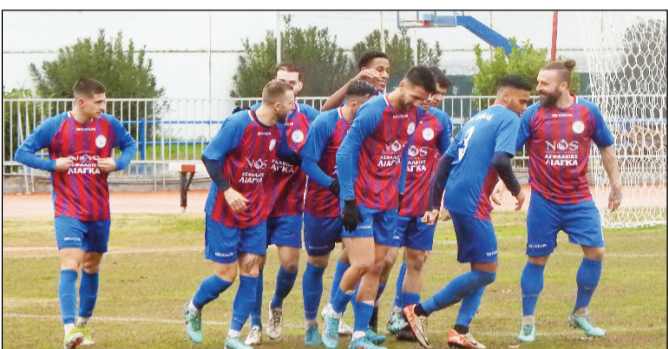
Να επιστρέψουν στις νίκες θα προσπαθήσουν σήμερα τα Τρίκαλα

Ο Α.Ο Τρίκαλα φιλοξενεί σήμερα τον Τηλυκράτη