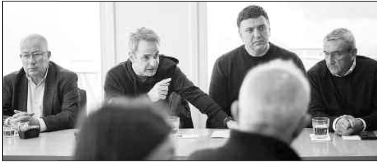
Αναγκαία η ψυχραιμία