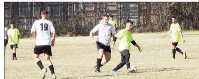
Συνεχίζεται η προσπάθεια των ομάδων της Β' Ερασιτεχνικής

Οι ομάδες που έχουν στόχους θα επιδιώξουν να τους πησιάζουν