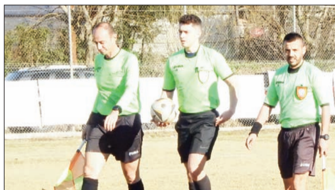
Ο νεαρός Ζιούτος θα σφουρίξει το ντέρμπι ανάμεσα στον Πορταϊκό και την Λυγαριά