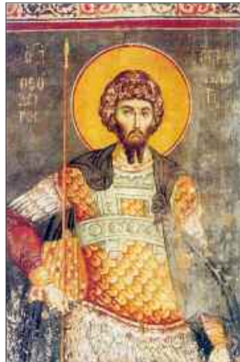
Άγιος Μεγαλομάρτυρας Θεόδωρος ο Στρατηλάτης εξ Αμάσειας του Πόντου

ρά σιδερένια νύχια και στις πληγές του βάζουν αναμμένα δαδιά. Μετά έτριψαν κεραμίδια πάνω στις κομματιασμένες σάρκες του και τον ρίχνουν στο τέλος στη φυλακή, ασφαλίζοντας τα πόδια του με το «Κολαστήριο Ξύλο». Μετά από επτά ημέρες, ο Λικίνιος διέταξε να τον σταυρώσουν. Διαπέρασαν τα πόδια, τα χέρια και τα κρυφά μέλη του με περόνη. Ταυτόχρονα,