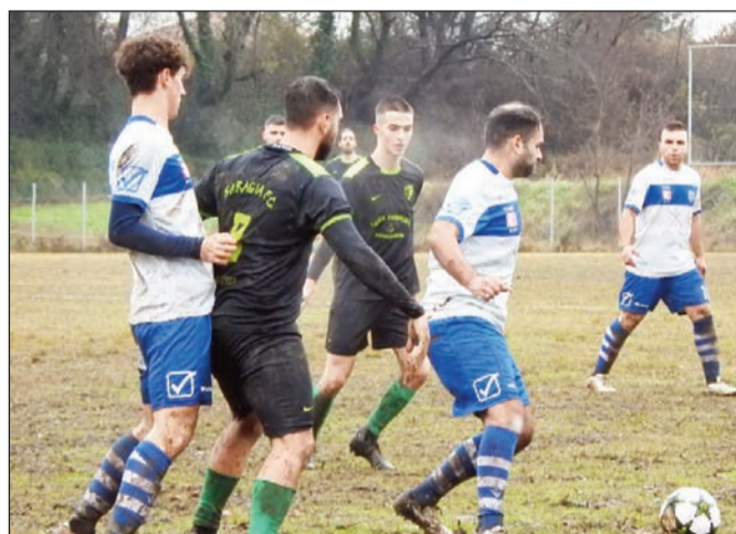
Αμφίροπο παιχνίδι στη Μουριά με τον Πορταϊκό να φιλοξενεί την Λυγαριά

φαβορί και είναι το Πρίνος. Η ομάδα του Γιάννη Κέφου έχει αφήσει πίσω της τον «βαρύ» αποκλεισμό στο θεσμό του κυπέλλου και βλέπουν το πρωτάθλημα στο οποίο θέλουν βαθμούς απέναντι στα Αμπελάκια.