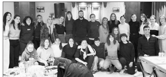
Μοναδική ατμόσφαιρα στην κοπή πίτας Θεόνη ΑΟΤ στο «Κτήμα Νικόλα