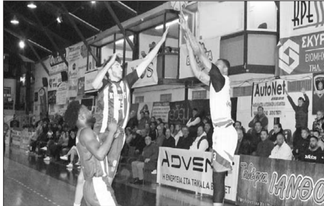
Το ζουμπί του Πανερευθραϊκού θα ψάξει σήμερα ο ΑΟΤ.ΒC

Πρώτα και κύρια καλείται να προσαρμοστεί άμεσα και να αποδώσει το μπάσκετ που ξέρει και μπορεί. Μέσα από τις δηλώσεις τους οι παίκτες δεν το κρύβουν πως η άμυνα αποτελεί δυνατό χαρτί της ομάδας.