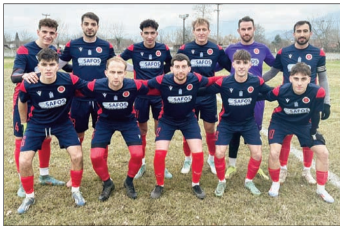
Το Νεοχώρι πέρασε με νίκη από το Δενδροχώρι

Το Δενδροχώρι σκόραρε στο 23' με τον Γουλιούλη κάνοντας το 1-0.