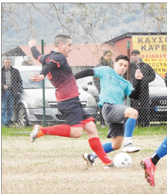
Νικηφόρα πέρασε από την Δήμητρα η ΑΕΤ