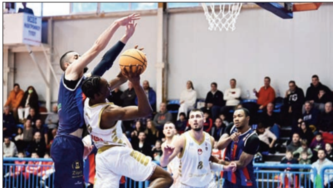
Δεν έφτασε μέχρι τέλους ο ΑΟΤ στην Ερυθραία.

Ο ΑΟΤ.ΒC γύρισε από το -17 αλλή στις κρίσιμες τελευταίες επιθέσεις υπέπεσε σε λάθη και έχασε 71-67 στον Πανερυθραϊκό