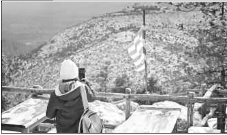
Τα... σκουφάκια για το κρύο αναγκαία και για τη νέα εβδομάδα

Συνελήφθη από αστυνομικούς της Διεύθυνσης Τροχαίας Αττικής 49χρονος οδηγός ταξί για επικίνδυνη οδήγηση καθώς οδηγούσε χωρίς ισχύουσα άδεια ικανότητας οδήγησης, υπό την επήρεια αλκοόλ και εκτελώντας επικίνδυνους ελιγμούς.