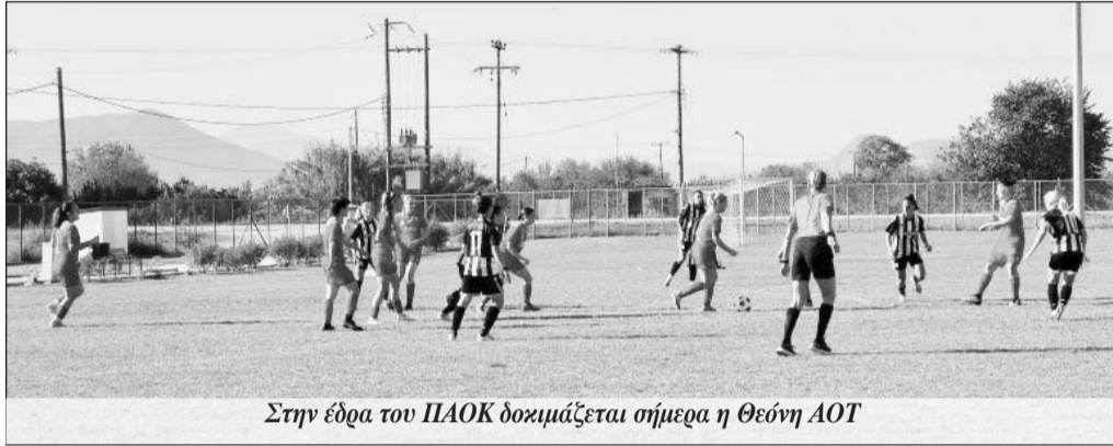
Στην έδρα του ΠΑΟΚ δοκιμάζεται σήμερα η Θεόνη ΑΟΤ

Οι γυναίκες Θεόνη ΑΟΤ δοκιμάζονται σήμερα στην έδρα του ΠΑΟΚ τον οποίο γνωρίζουν απ' έξω και ανακατωτά