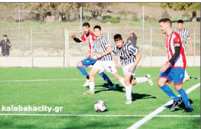
Αθλος και Καστράκι στο «απόλυτο» ντέρμπι

Σε αντίθεση με τις παραπάνω ομάδες το Βαλτινό θα κερδίσει χωρίς αγώνα και το Παλ/ρο με... αγώνα.