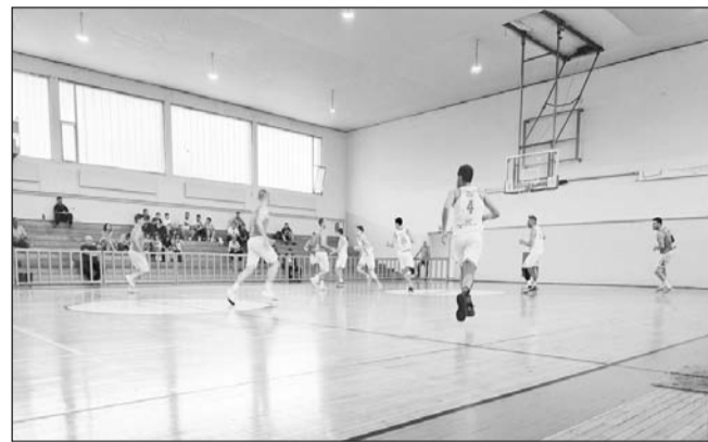
Τα ποιοτικά παιχνίδια καλά κρατούν στο πρωτάθλημα Α1 ΕΣΚΑΘ