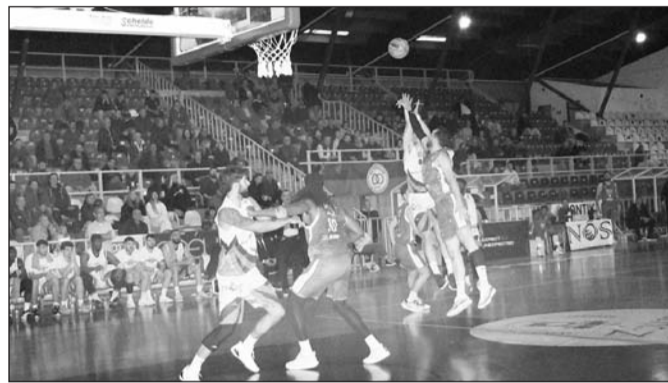
Την τέχνη του θέλει να ξεδιπλώσει σήμερα ο ΑΟΤ

Μάλιστα τα προηγούμενα χρόνια πέτυχε απίστευτες υπερβάσεις με την μασκετική κοινότητα να σπεύδει να φωτίσει το φαινόμενο. Συνεπώς ο ΑΟΤ καλείται να πραγματοποιήσει εμφάνιση βγαλμένη από τα καλύτερά του για να πετύχει ένα πραγματικά μεγάλο αποτέλεσμα, στέλλοντας ένα ακόμη μήνυμα.