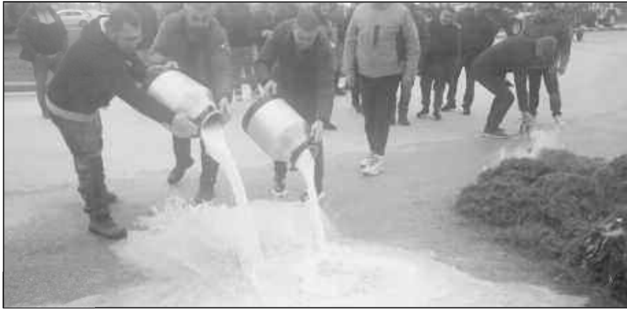
Δυστυχώς τις περισσότερες φορές ο κόπος τους πάει χαμένος!