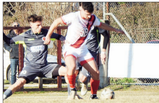
Ακόμα μια νίκη θα ψάξει η ΑΕΤ για να διατηρήσει τη διαφορά στην κορυφή. Σήμερα υποδέχεται τα Μετέωρα

Η προσοχή απαραίτητη ωστόσο για τους γηπεδούχους, ενώ οι φιλοξενοούμενοι θα κάνουν την προσπάθειά