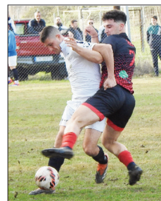
Ο Οικονόμου προσπαθεί ν' αποφύγει τον Νίντο