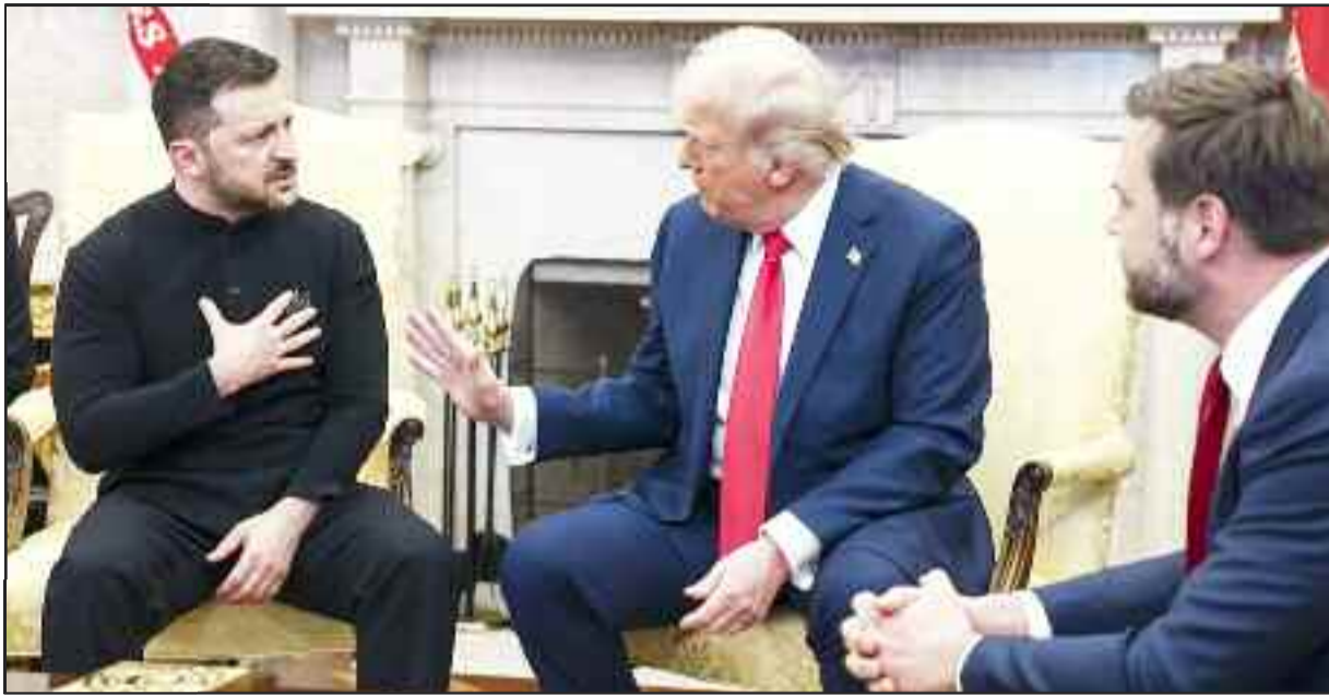
Δεν τους λες και αγαπημένους!