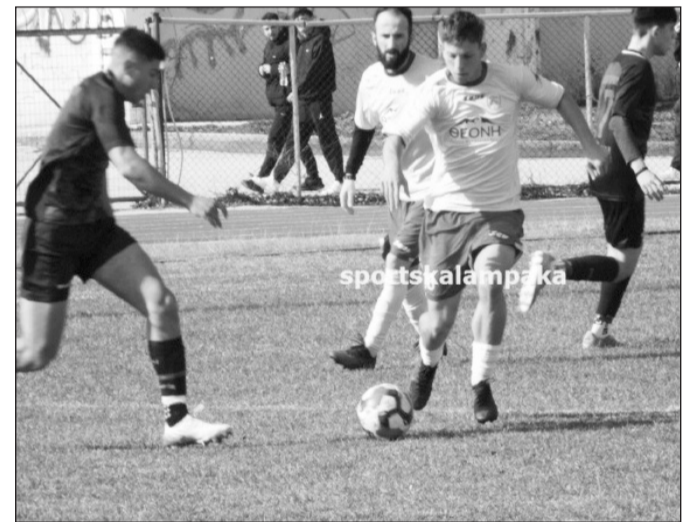
Τα Μετέωρα κέρδισαν 3-1 το Δενδροχώρι