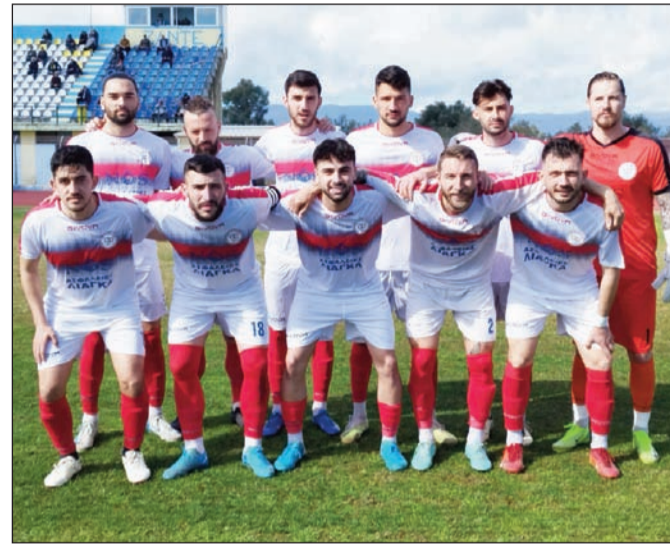
Ο Α.Ο. Τρίκαλα επέστρεψε με ισοπαλία 1-1 από την Ζάκυνθο

Ζάκυνθος (Σάκης Θεοδοσιάδης): Μπαλαούρας, Παρασκευόπουλος, Λιβέρης, Μούστα, Γουσέτης (73' Πα-