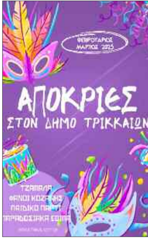
στην πλατεία Ρήγα Φεραίου. Ώρα έναρξης 11:00.