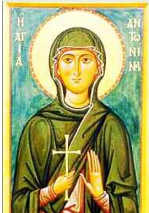
Αγία Μάρτυς Αντωνίνα η εκ Νίκαιας και εν Νικομηδείας μαρτυρούσα.

«Θάλαμος η θάλασσα νυμφικός γίνη, Αντωνίνα κρύπτουσα νύμφην Κυρίου»