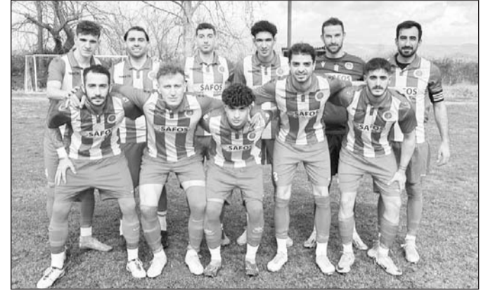
Το Νεοχώρι πέρασε εύκολα από το Μικρό Κεφαλόβρυσο

ΝΕΟΧΩΡΙ: Ευαγγέλου, Γκάτης, Τσιαμάντας ( 46' Γεωργούλας), Τέλιος ( 55' Τσιγαριδίας Κ.), Τσιγαριδίας Α. ( 55' Γούλας), Βασιλείου, Ανδρέου (46' Τσιακμάκης), Παπαδόπουλος ( 46' Παπαλεξανδρής), Βαρναβίδης, Μαντζανάς, Λαγκαδινός.