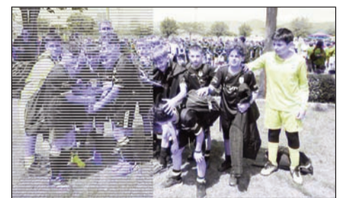
Το τουρνουά που διοργανώνει κάθε Πάσχα η Δήμητρα Απόλλων έλκει ποδοσφαιρικά talέντα στα Τρίκαλα

Καλωσορίζουμε με ιδιαίτερη τιμή στο 19ο ποδοσφαιρικό τουρνουά «Αποστολής Γκαραγκάνης» τον Αστέρα Τρίπολης . Με τον Αστέρα διατηρούμε εξαιρετικές σχέσεις πολλά χρόνια και μας τιμάει κάθε χρόνο με την παρουσία του. Οι Αρκαδες δραστηριοποιούνται με μεγάλη επιτυχία στις αναπτυξιακές ηλικίες όλα τα χρόνια της ύπαρξής τους. Τους ευχαριστούμε που θα παρευρεθούν στο τουρνουά ακόμα μια χρονιά!