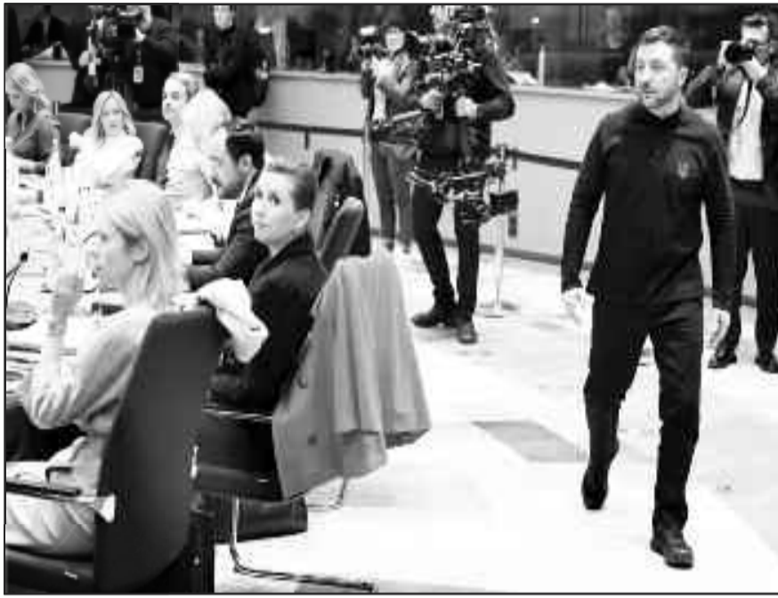
Εκτός από την Ουκρανία... ψάχνεται και η Ευρώπη!