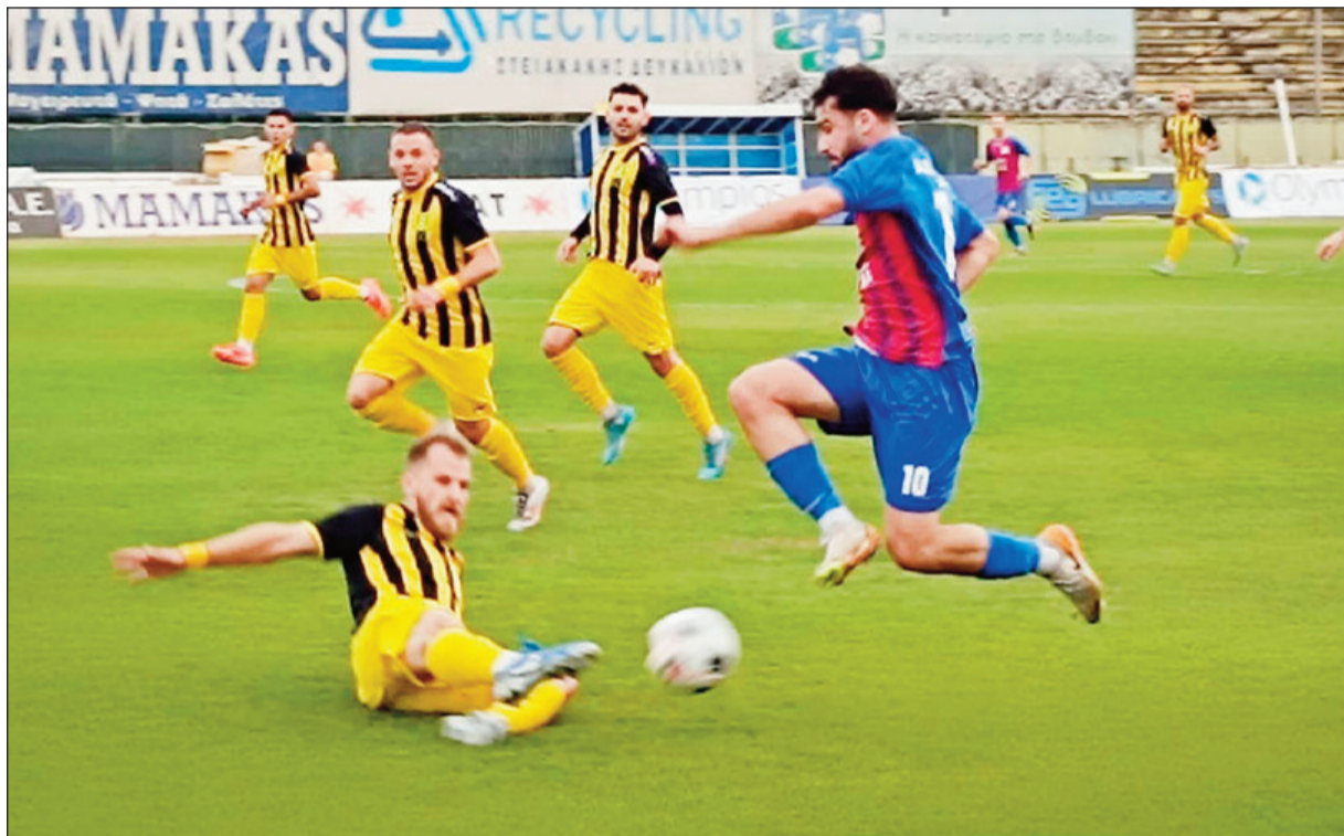
Στιγμιότυπο από τον αγώνα του α' γύρου στην Καρδίτσα

Ο ΑΟΤ φιλοξενεί την πρωτοπόρο Αναγέννηση Καρδίτσας