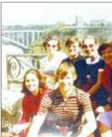
Χορευτές με τον χοροδιδάσκαλο στις καταρράκτες του Νιαγάρα

ομοίωμα του Κωνσταντίνου Καραμανλή, που αποτέλεσε έκπληξη για την αποστολή και την συγκίνησε!