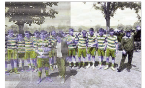
Ο Αστέρας Τρίπολης θα είναι μια από τις ομάδες που θα βρεθεί στο φετινό τουρνουά της Δήμητρας

Το ποδοσφαιρικό τουρνουά της Δήμητρας Απόλλων αποτελεί θεσμό στα αθλητικά δρώμενα των Τρικάλων και όχι μόνο.