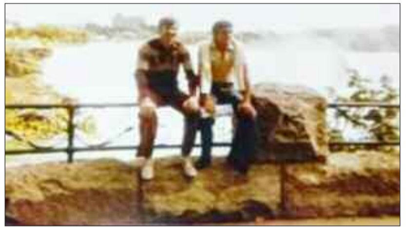
Στους καταρράκτες του Νιαγάρα