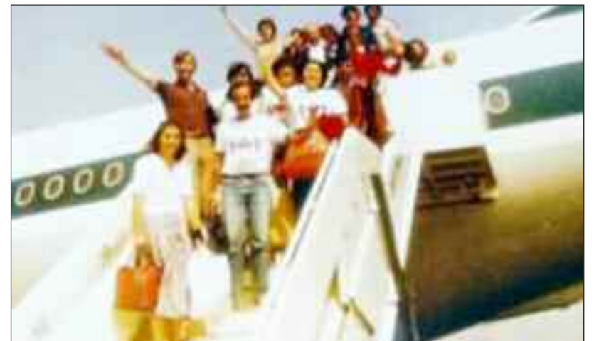
Η επιστροφή στην Ελλάδα

Η αποστολή αναχώρησε συγκινημένη από αυτό το ανεπανάληπτο ταξίδι για την Ελλάδα στην οποία φτάνοντας πολλά παιδιά του χορευτικού φιλούσαν το έδαφος.