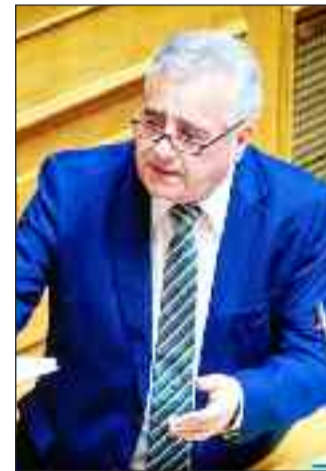
Όταν ο βουλευτής της ΝΔ, Κώστας Κατσαφάδος, τον

Ωστόσο, οφείλουμε να αναδείξουμε τα προβλήματα της κοινωνίας και να γεφυρώσουμε το χάσμα ανάμεσα στην κοινωνία και το κοινοβούλιο».