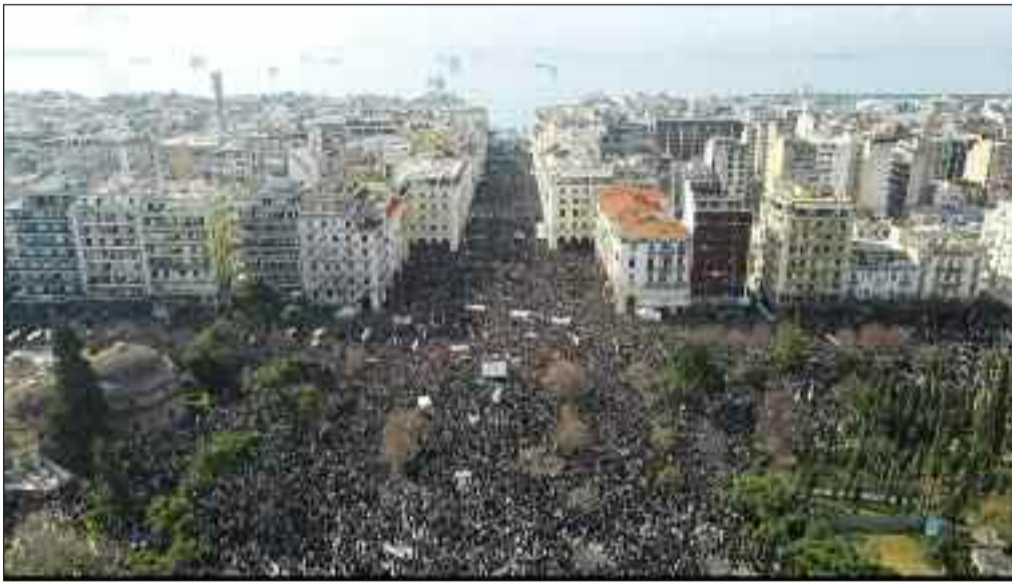
«Η «πλατεία» ήταν γεμάτη, με το νόημα που 'χε κάτι από τις φωτιές»

*Γιατί το “Μέσον”- η “Πλατεία” είναι το ΜΗΝΥΜΑ