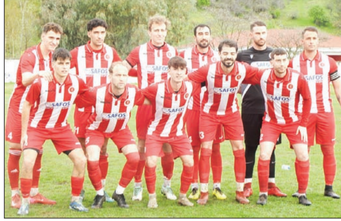
Ξεκινάει σήμερα τη διαδικασία των μπαράζ ανόδου ο «Διγενής» με αντίπαλο τον Αστέρα Καρδίτσας