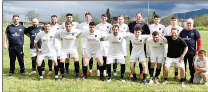
Το Παλαιομονάστηρο, μετά από πολλά χρόνια απουσίας θέλει να επιστρέψει στην Α' Ερασιτεχνική