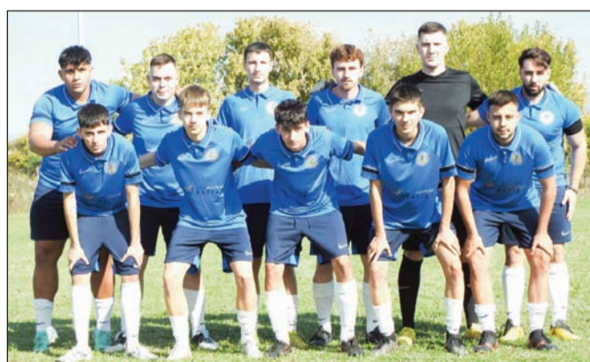
Ο Αγιος Οικουμένιος ξερέ τα λημέρια της Α' Ερασιτεχνικής από την πρόσφατη παρουσία του

4Η ΑΓΩΝΙΣΤΙΚΗ ΕΛΕΥΘΕΡΟΧΩΡΙ – ΠΑΛΑΙΟΜΟΝΑΣΤΗΡΟ 0-3