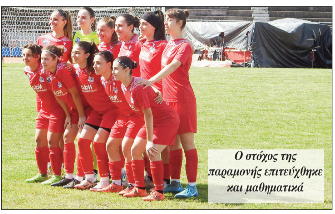
Ο στόχος της παραμονής επιτεύχθηκε και μαθηματικά

λου, Κατσιγιάννη. ΡΕΑ: Μ. Κοτσάκι, γεωργούλα, Νικοπούλου, παντέρη, Κελαϊδη, Μπασούρη, ΣΙΤΟΥΜΑ, Ζώτου, Δαφέρμου (68' ΝΑΚΑΥΕΝΖΕ), ΥΟΣΙΕ ΣΙΖΟΥΚΑ.