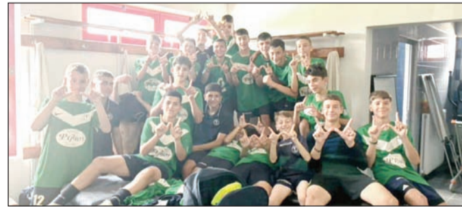
Πανηγυρισμοί από τους νικητές για τη νίκη προσέπραση

Πρωταθλητής- Αίας Αγ. Οικουμένιος - Άθλος Πηγή- ΑΕΚ Σαραγίων Νεοχώρι- Μετέωρα ΑΟ Τρίκαλα- Δήμητρα Απόλλων 21η ΑΓΩΝΙΣΤΙΚΗ Πύργος- Αίας Άθλος- Πορταϊκός ΑΕΚ Σαραγίων - Πρωταθλητής Μετέωρα- Αγ. Οικουμένιος