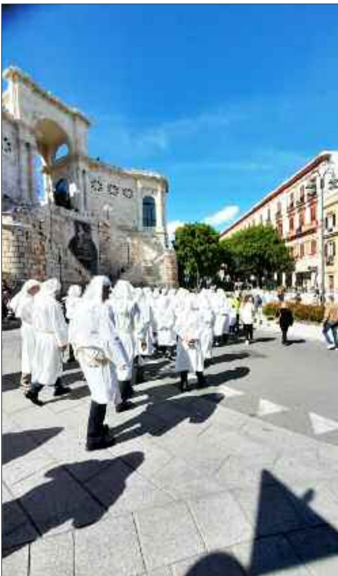
ΜΕΓΑΛΗ ΠΑΡΑΣΚΕΥΗ ΣΤΟ ΚΑΛΙΑΡΙ

ΥΓ. Ευχαριστώ το Γραφείο Ταξιδίων Holiday Center Αμαρουσίου για την άψογη διοργάνωση του ταξιδιού μου στην Σαρδηνία.