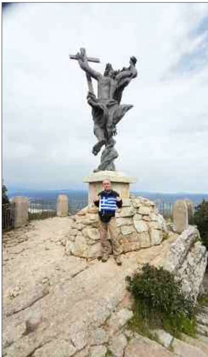
ΜΟΝΤΕ ΟΡΤΟΜΠΕΝΕ Ο ΧΡΙΣΤΟΣ ΛΥΤΡΩΤΗΣ