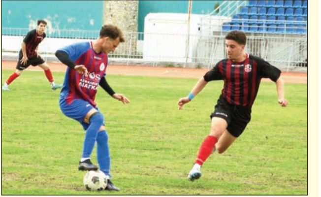
Ξεκινούνται σήμερα τα Τρίκαλα

Επιστρέφουν στα γήπεδα οι ομάδες. Χωρίς αγώνα κερδίζει τον Σβωρόνο ο ΑΟΤ