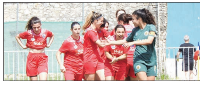
Πανηγυρισμοί από τις γυναίκες του ΑΟΤ για την παραμονή τους