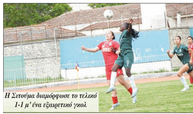
Η Σιτουμά διαμόρφωσε το τελικό 1-1 μ' ένα εξαιρετικό γκολ