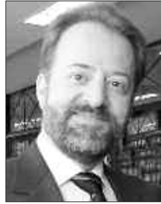
Επιμέλεια: Λευτέρης Σαββουλίδης Θεολόγος Α. Π. Θ. Anatolikathorthodoxias.blogspot.com

Συγκλονισμένη η αγία Πελαγία από το όραμα, πήρε την απόφαση να γίνει κοινωνός του μυστηρίου του βαπτίσματος και πήγε να συναντήσει τον Αρχιεπίσκοπο. Θέλοντας να αποφύγει την βέβαιη οργή της μητέρας της, ισχυρίστηκε ότι θα πήγαινε να επισκεφθεί την τροφό της, η οποία ζούσε σε άλλη πόλη, όμως η αγία Πελαγία μετέβη στη Ρώμη. Ο «φωτισμένος» Αρχιεπίσκοπος Λίνος δέχθηκε την αγία Πελαγία και τη βάπτισε Χριστιανή.