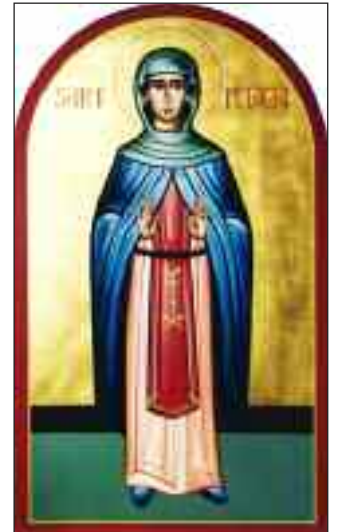
Αγία Πελαγία η Μάρτυς

«Το πέλαγος της ζωής, διήλθες πανευκλεώς, Πελαγία Μάρτυς πανεύφημε· εν τη πίστει θερμώς διέπρεψας, των βασάνων είληφας την ενέργειαν· διό νυν τον Χριστόν, ικέτευε υπέρ ημών»