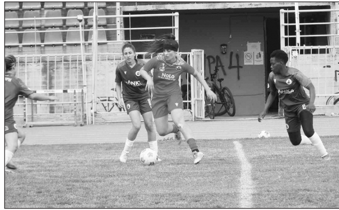
Η Θεόνη ΑΟΤ θα πάρει άνετους βαθμούς με Δόξα

Την ήττα λοιπόν γνώρισαν τα κορίτσια του ΑΟ Τρικάλα για το πρωτάθλημα της Α' Εθνικής κα-