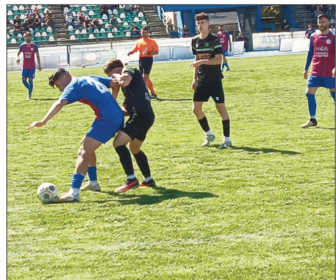
Αδιάφορο το σημερινό (τελευταίο παιχνίδι) για Τρίκαλα και Ολυμπιακό Βόλου

καλίδη έχει την ώθηση των σπουδαίων αποτελεσμάτων του τελευταίου διαστήματος (Ζάκυνθος, Καρδίτσα, Άρτα) και δείχνει αποφασισμένη να αποφύγει τον δεύτερο συνεχόμενο υποβιβασμό.