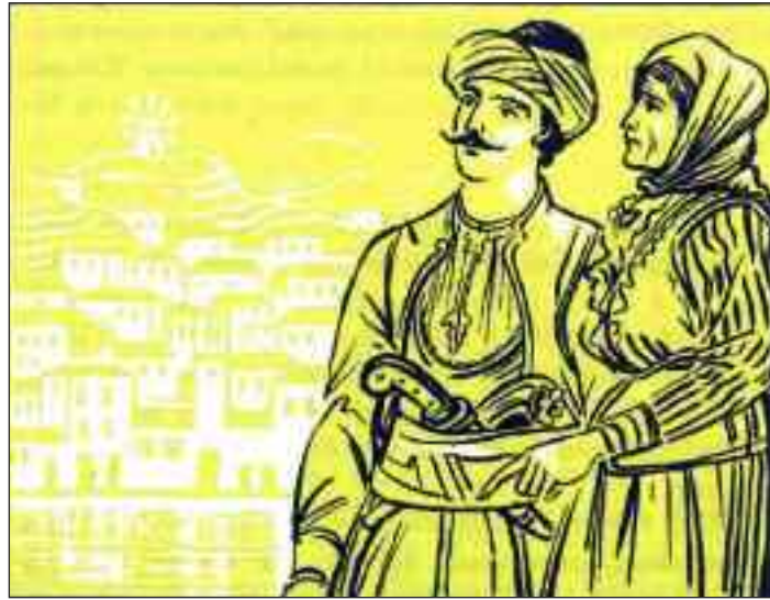
Η μάνα Καραντάναινα με τον αλλαξοπιστήσαντα γιο της λίγο πριν τον ρίξει από τον εξώστη στο λιθόστρωτο.

Θέμα του: Η τραγική περίπτωση μιας Ελληνίδας μάνας,