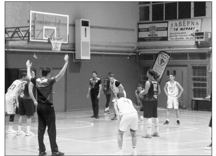
Άρκετοι κρίκοι πρέπει να συνυπάρχουν κατάλληλα στους επιχώριους συλλόγους

Πάντως όταν οι σφυγμοί πέφτουν πρωταγωνιστές και άνθρω-