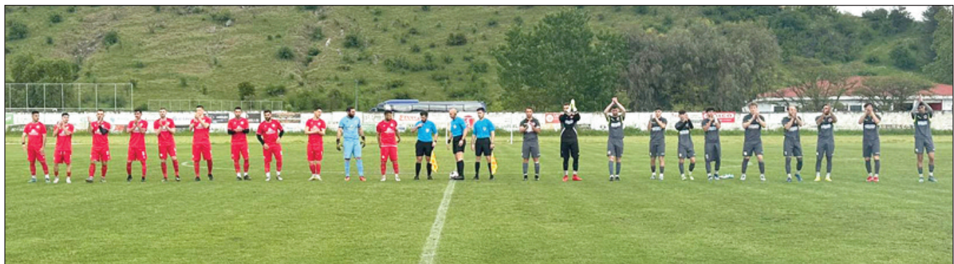
Το Νεοχώρι θα παίζει στη Στυλίδα με μοναδικό στόχο τη νίκη

Η ομάδα του Νεοχωρίου μπορεί να μην ξεκίνησε ιδανικά την διαδικασία των μπαράζ παραχωρώντας ισοπαλία 1-1 στον Αστέρα Καρδίτσας, το γεγονός όμως πως από το 37' έπαιξε με 10 παίκτες δείχνει πως έχει δυνατότητες να τα καταφέρει. Το σύνολο του Σπύρου Ευαγγέλου ταξιθεύει με καλή ψυχολογία και ξεκάθαρη στόχευση: Η νίκη είναι το ζητούμενο που θα του δώσει προβάδισμα και θ' αυξήσει τις ελπίδες ανόδου. Η αποστολή είναι δύσκολη, όπως άλλωστε όλα τα παιχνίδια και σε καμιά περίπτωση δεν πρέπει να ξεγελά το γεγονός πως οι γηπεδούχοι σκεφτόταν να μην συμμετάσχουν στα μπαράζ, ούτε να στηριχτούν στην ήττα της προεμι-