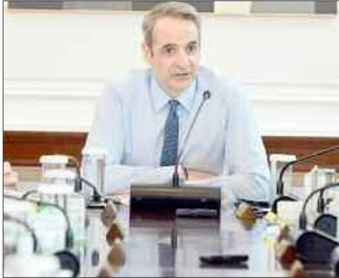
βολο των ιδρυμάτων. Όπως τονίστηκε στη σύ-

Παράλληλα, προβλέπεται να επιβάλλονται αντίστοιχες συνέπειες και σε πανεπιστήμια που δεν εφαρμόζουν τον νόμο ή τις σχετικές αποφάσεις. Ιδιαίτερη έμφαση δόθηκε και στην ανάγκη άμεσης εφαρμογής των εγκεκριμένων Σχεδίων Ασφαλείας από το σύ-