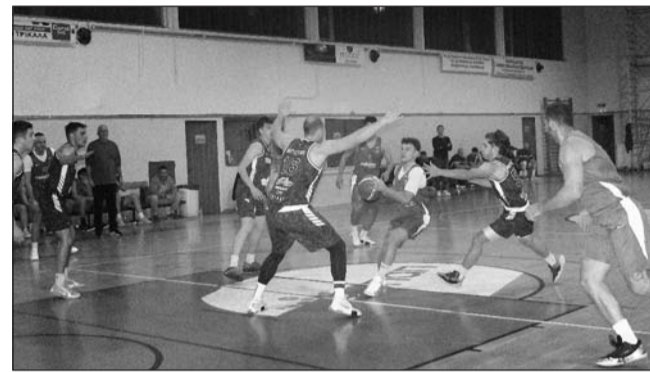
Ξεχωριστή σημειολογία έχουν οι σημερινές αγώνες της Α1 ΕΣΚΑΘ

Ασφαλώς η προσήλωση είναι απαραίτητη, αφού χωρίς αυτήν