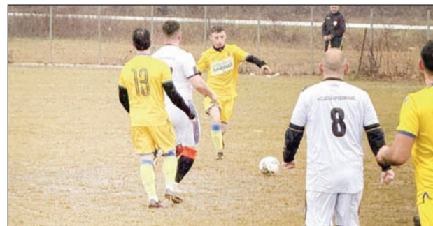
Το Γοργούρι θα φιλοξενήσει το Βαλτινό στο ντέρμπι της Κυριακής

• Το Βαλτινό δοκιμάζεται αύριο στο Γοργούρι σε αγώνα με έντονο βαθμοποιοτικό ενδιαφέρον • Τους Αγίους Αποστόλους φιλοξενούν τα Σαράγια