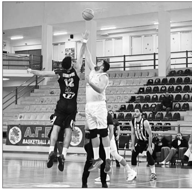
Πλούσια συναισθηματικά θα προσφέρει και η 20η αγωνιστική Α2 Εθνικής

Αποδεδειγμένα ορισμένες ενέργειες τακτικής ή συστήματα που δεν έχουν πολυχηρημοποιηθεί μπορούν να αλλάξουν τα δεδομένα.