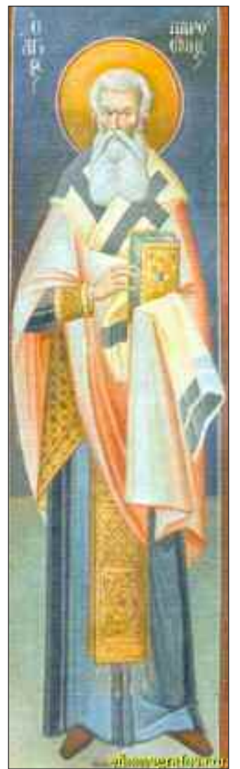
Όσιος Παρθένιος Επίσκοπος Λαμψάκου ο «Προστάτης των καρκινοπαθών»

«Φως νοερόν το εκ φωτός, Πατρός του προανάρχου, Υιέ Θεού και Λόγε, ο καταυγάζων πάσαν την οικουμένην θεϊκώς, φωτισόν μου τας φρένας, τον νουν και τον λογισμόν, του ανυμνήσαι σήμερον την φαιδράν ταύτην πανήγυριν και σεμνοπρεπεστάτην του Οσίου Παρθενίου· αυτός γάρ αληθώς εν γη θαυμασίαν διέτέλεσε ζωήν και πολιτείαν· διά τούτο συνελθόντες ευφημούμεν αυτόν, ως μέγαν μύστην Θεού της χάριτος»