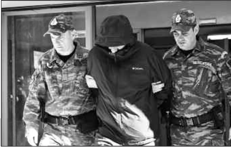
Σαν κατασκοπευτική ταινία στο σινεμά!