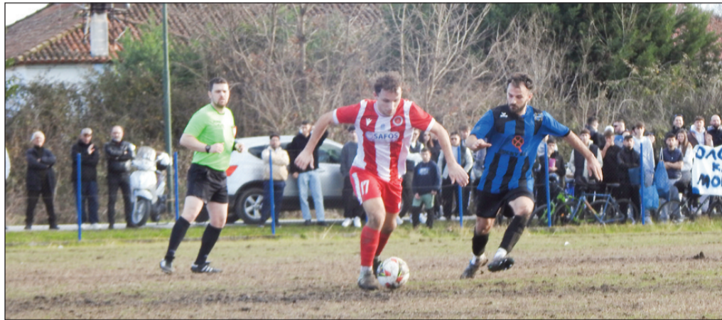
Δύσκολο παιχνίδι θα δώσει σήμερα το Νεοχώρι στη Πύλη απέναντι στον Πορταϊκό

Τα Μετέωρα, μπορεί να έχουν τις... κεραίες τενωμένες στο γήπεδο της Πύλης, η προσοχή και η σοβαρότητα όμως των παικτών