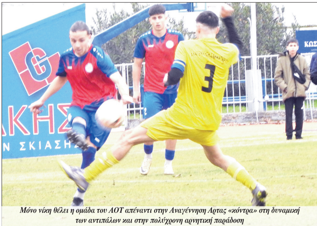
Μόνο νίκη θέλει η ομάδα του ΑΟΤ απέναντι στην Αναγέννηση Άρτας «κόντρα» στη δυναμική των αντιπάλων και στην πολύχρονη αθλητική παράδοση