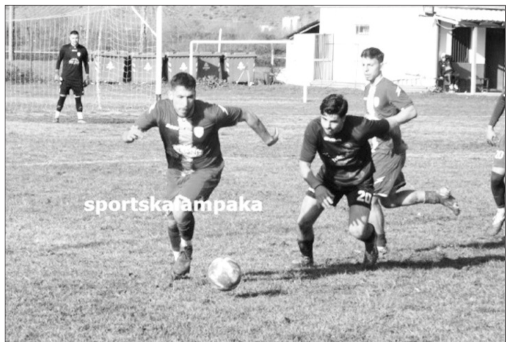
Εύκολη νίκη πέτυχαν τα Μετέωρα στον Κεφαλοβρυσιακό

Τα Μετέωρα κέρδισαν 0-6 στον Κεφαλοβρυσιακό