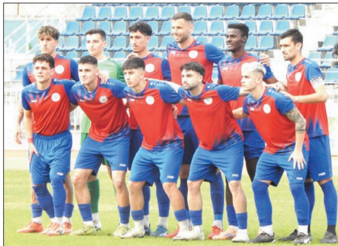
Αιφνιδιασε η ομάδα των Τρικάλων κι έφτασε στην επικράτηση επί της Αναγέννησης Άρτας

Την ερχόμενη Τετάρτη υπάρχει εμβόλιμη αγωνιστική στο πρωτάθλημα. Τα Τρίκαλα θα κερδίσουν στα χαρτιά τον Θεσπρωτό αλλά δεν μείνουν χωρίς αγώνα. Θα παίξουν στο στάδιο με την Κόρινθο για την προημιτελική φάση του κυπέλλου ερασιτεχνών.