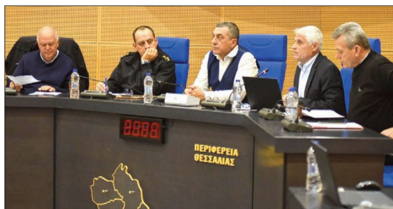
Στις επάλξεις όλη η Θεσσαλία για το Παγκόσμιο ανωμάλου δρόμου ενόπλων δυνάμεων

Από την πλευρά του, το μέλος της Οργανωτικής Επιτροπής και εκπρόσωπος της Συντονιστικής Επιτροπής της Περιφέρειας Θεσσαλίας, Στρατηγός Ε.Α. Ηλίας Λεοντάρης αναφέρθηκε στα οφέλη που θα αποκομίσει η Θεσσαλία από τη διοργάνωση των αγώνων ανωμάλου δρόμου κυρίως σε θέματα προβολής