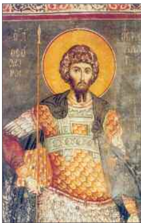
Άγιος Μεγαλομάρτυρας Θεόδωρος ο Στρατηλάτης εξ Αμάσειας του Πόντου

Ο Λικίνιος, διέταξε τη σύλληψη του αγίου Θεόδωρου και την ενώπιόν του μεταφορά. Στον μεταξύ τους διάλογο, ο άγιος Θεόδωρος εμφανίζεται σταθερός στην πίστη του και δεν υποκύπτει, παρά την πίεση