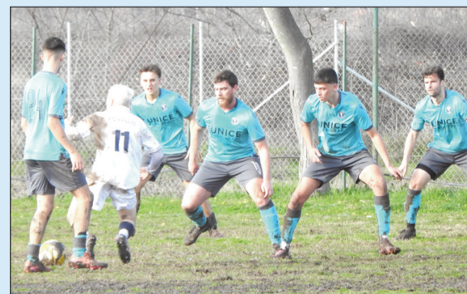
Φάση από το παιχνίδι στη Μπαλκούρα

Πούλιος (46' Καραγιάννης), Οικονόμου (65' Βλάχος), Πρεβέντης, Σκαρλέας (46' Μπελετσιώτης), Τσουκαλάς, Κάντας (50' Βλαχόπουλος), Στεφάνου, Χρυσσοτομής (65' Ζυγολίκα), Τσιομήτας, Μπραντίτσας.