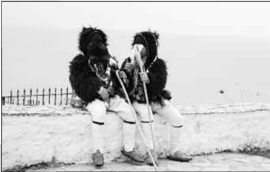
Βαριές Απόκριες φέτος στα Τρίκαλα