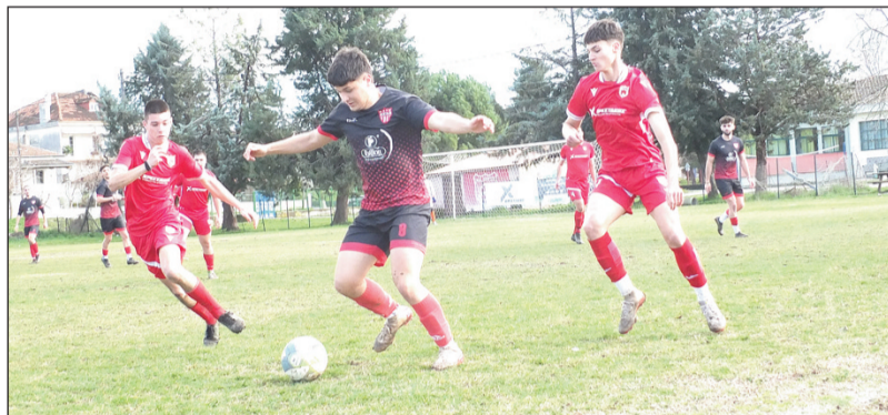
Μοιρασιά στο Πύργος- ΑΕΤ