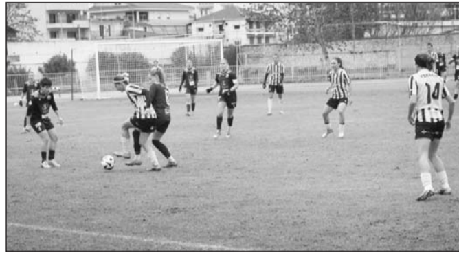
Κινητικότητα καταγράφεται σε πολλά μέτωπα στο γυναικείο ποδόσφαιρο

Το χαρακτηριστικό του στοιχείου είναι το απρόβλεπτο, οπότε όλοι μπορούν να δρέψουν καρπούς.