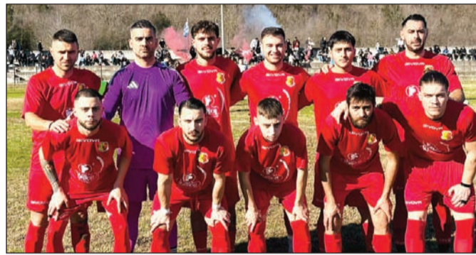
Το Βαλτινό πέτυχε σπουδαία εκτός έδρας νίκη στο Γοργογύρι

Το νικηφόρο πέρασμα του Μεγαλοχωρίου στο Μικρό Κεφαλόβρυσο κερδίζοντας 0-4 διατήρησε την ομάδα του Περικλή Βασιλείου στην κορυφή του 1ου ομίλου, μια