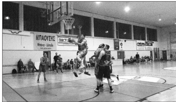
Μια ακόμη ενδιαφέρουσα αγωνιστική ξεδιπλώθηκε στο πρωτάθλημα της Α1 ΕΣΚΑΘ

ήθελε ιδιαίτερη προσοχή αφού ο αντίπαλος έχει καλές βάσεις και παρότι έχασε έδαφος φέτος μπορεί να κάνει ζημιές.