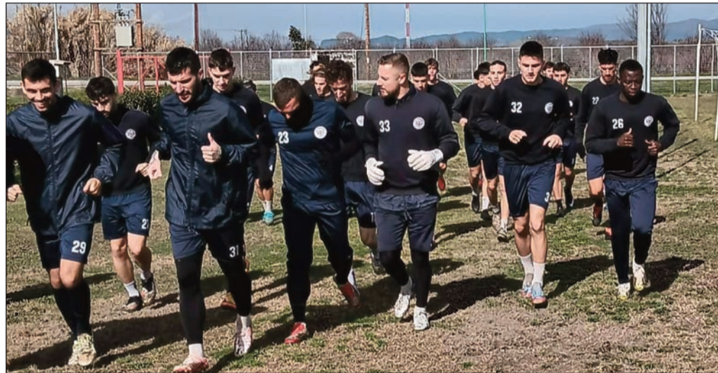
Ο ΑΟΤ συνεχίζει την προετοιμασία για κύπελλο και πρωτάθλημα

Την ερχόμενη Κυριακή η τρικαλινή ομάδα θ' αντιμετωπίσει στο πρωτάθλημα τον