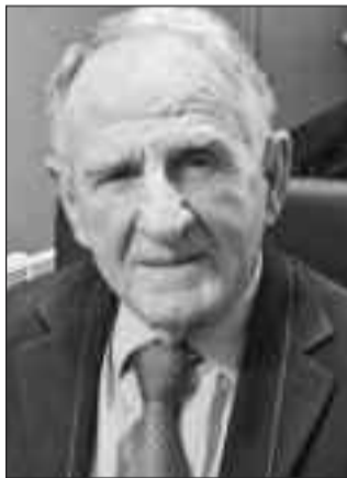
Γράφει ο Δρ.