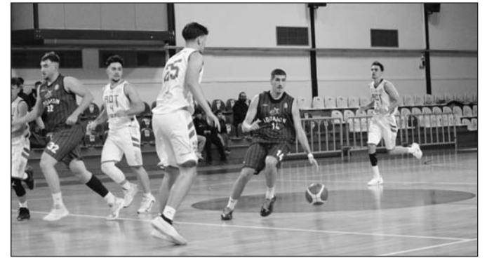
Και στην ΕΑΛ ο ΑΟΤ στάθηκε στο ύψος των περιστάσεων

Το προβάδισμα άλλαξε πολλές φορές χέρια και τελικά χα-