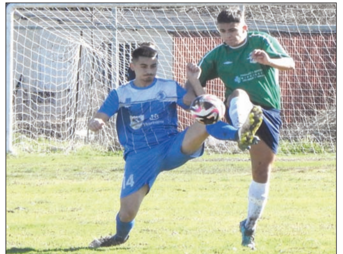
Φάση από τον αγώνα Ριζαριό - ΑΕ Φαρκαδόνων

Π ιο κοντά στο στόχο της ανόδου βρίσκεται το Βαλτινό κερδίζοντας 0-2 στο Γοργογύρι.