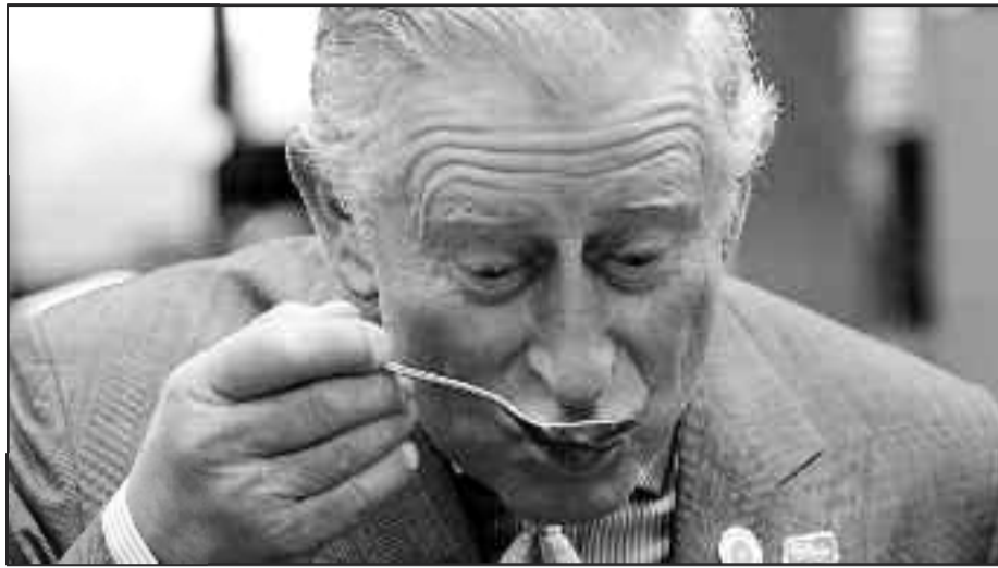
Και βασιλιάς να είσαι την... σούπα θα την ρουφήξεις!