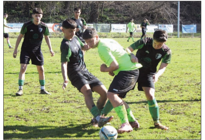
Μονομαχία στον αγώνα Σαραγίων - Αγίων Αποστόλων

• Το Βαλτινό 0-2 στο Γοργογύρι • Κέρδισαν τα Σαράγια, ισοπαλία η ΑΕ Φαρκαδόνων, ακάθεκτο το Μεγαλοχώρι