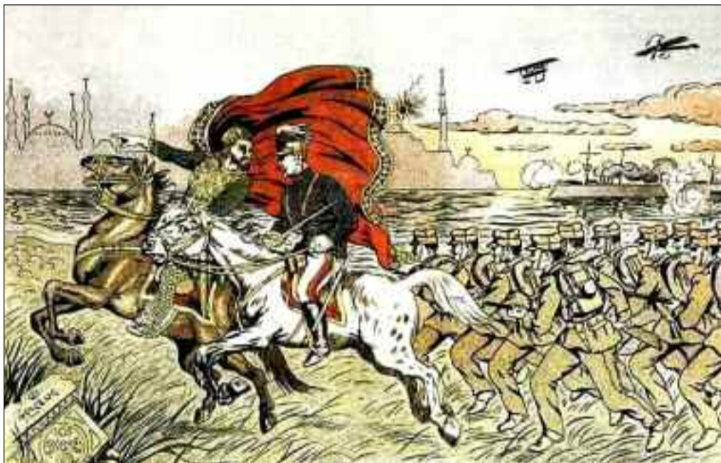
Ο Αυτοκράτωρ του Βυζαντίου Κωνσταντίνος Παλαιολόγος οδηγεί τον Βασιλέα των Ελλήνων Κωνσταντίνο με τον Ελληνικό Στρατό το 1912-1913, δείχνοντάς του την Αγία Σοφιά. [Πηγή: Γεωργίου Ρούσου: Νεώτερη Ιστορία του Ελληνικού Έθνους, Αθήναι 1976, τόμος 5ος ]