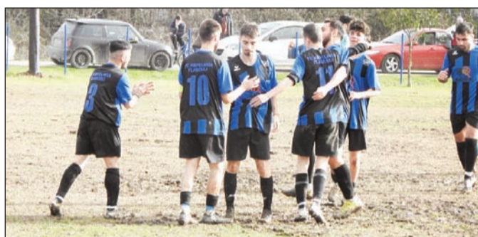
Πανηγυρισμοί από τους παίκτες Αμπελακίων/ Φλαμουλίου

ρεία κερδίζοντας μια ομάδα η οποία και αυτή στα τελευταία παιχνίδια είχε θετική πορεία.