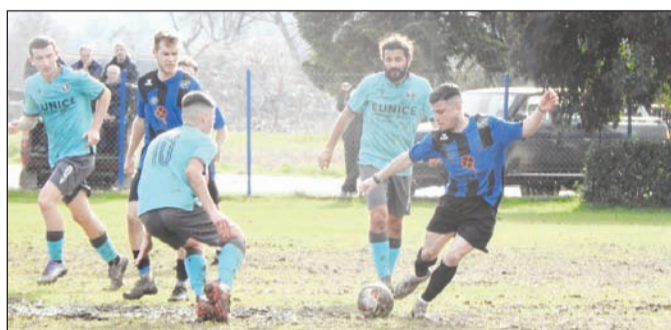
Ο Μήτσιος προσπαθεί ν' αποφύγει τον αντίπαλό του