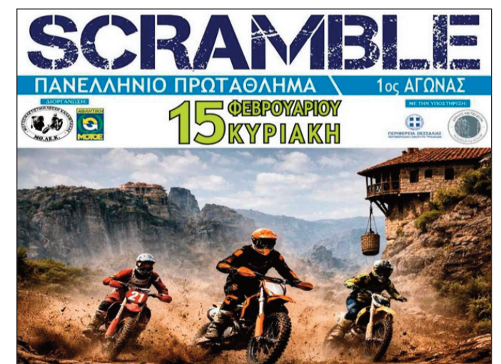
Ο αγώνας σκραμπλ της ΜΟΛΕΚ θα προσφέρει αξιόπετα οδηγικά στιγμιότυπα

Η είσοδος για το κοινό είναι ελεύθερη. Ώρα έναρξης: 11:00 π.μ.