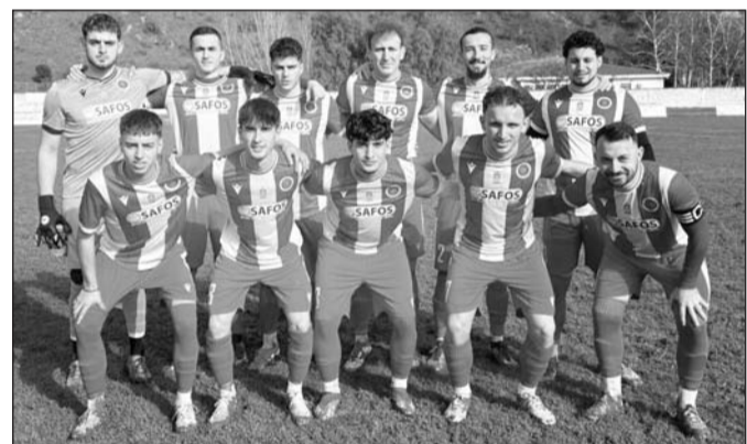
Το Νεοχώρι ξεπέρασε με ενκολία το Παλαιομονάστηρο

Δουλεράκης, Πυκνάδας(60' Ζαΐμι), Καλέτσος, Κ. Πολυγένης, Παπαγιάννης, Καφρί-