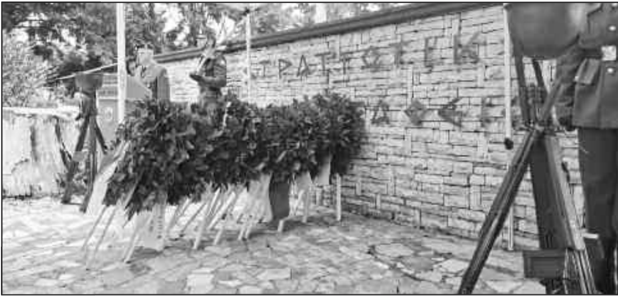
Σημαντικό να μην λησμονείς όσους προσέφεραν για την πατρίδα