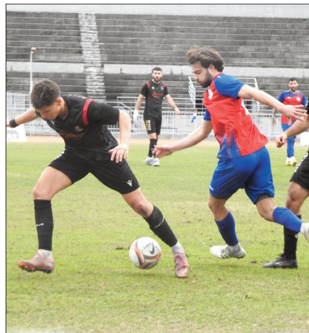
Ο ΑΟ Τρίκαλα θα παίξει για τη νίκη στον Τηλυκράτη

Ο Α.Ο Τρίκαλα θα παίξει σήμερα (3 μ.μ) στον Τηλυκράτη