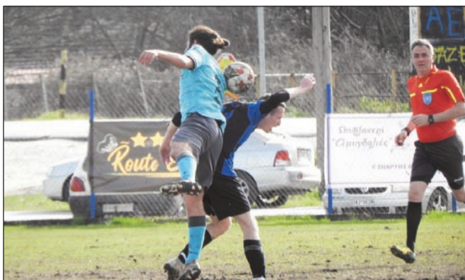
Δυνατές μονομαχίες στο Φλαμουλί

Στο ξεκίνημα του δεύτερου ημιχρόνου και συγκεκριμένα στο 49'