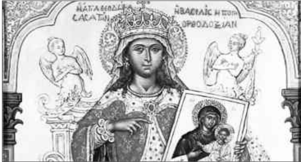
Αγία Θεοδώρα η Αυγούστα η «Ανακαλέσασα την Ορθοδοξίαν»

Όταν τελικά πέθανε ο Θεόφιλος, τη βασιλεία ανέλαβε η αγία Θεοδώρα, διότι ο Μιχαήλ ήταν πολύ μικρός. Η Αυγούστα, ως επίτροπος του υιού της συγκρότησε και επικύρωσε τα πρακτικά της Ζ' Οικουμενικής Συνόδου της Νίκαιας (787), καθάισε τον εικονομάχο Ιωάννη Ζ' από τον πατριαρχικό θρόνο, ενθρόνιζοντας τον Μεθόδιο ανακαλώντας τον από την εξορία. Επίσης, επί των ημερών της, αποφασίστηκε η οριστική αναστήλωση των ιερών