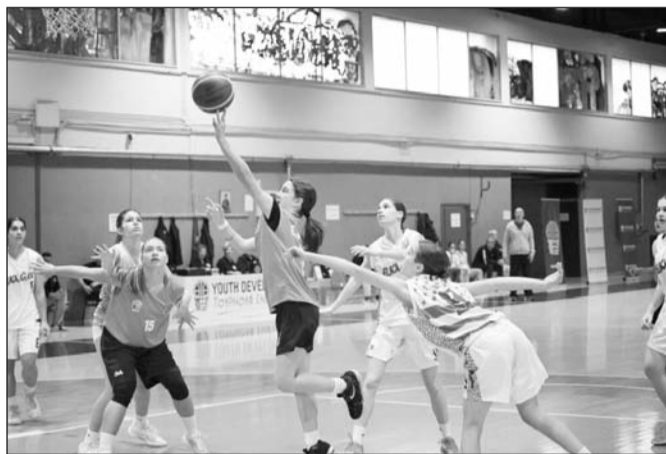
Κάθε μορφή τοπικού εμπνέει ιδιαίτερα την Τρικαλινή κοινή γνώμη

Με κάθε καιρική συνθήκη λοιπόν σπεύδουν στις αθλη-