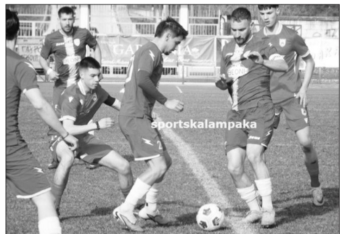
Τα Μετέωρα κέρδισαν 5-0 τον Πύργο

ΠΥΡΓΟΣ (Ε. Τσιούκας): Γκαραγκάνης, Σίμος, Ζυγούρης, Νίστας, Γεωργούλας, Καμπλιώνης, Σουλιάνης, Τζιρο-