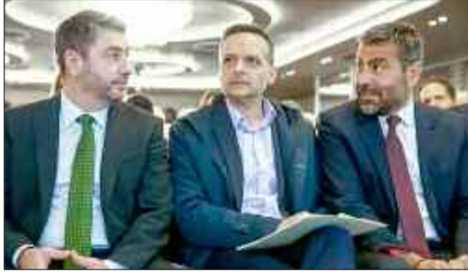
«Το ΠΑΣΟΚ είναι και παραμένει κόμμα εξουσίας

Σημειώνεται, ότι κύκλοι της Χαριλάου Τρικούπη υποστήριξαν ότι έγινε διαρροή ανύπαρκτων διαλόγων.