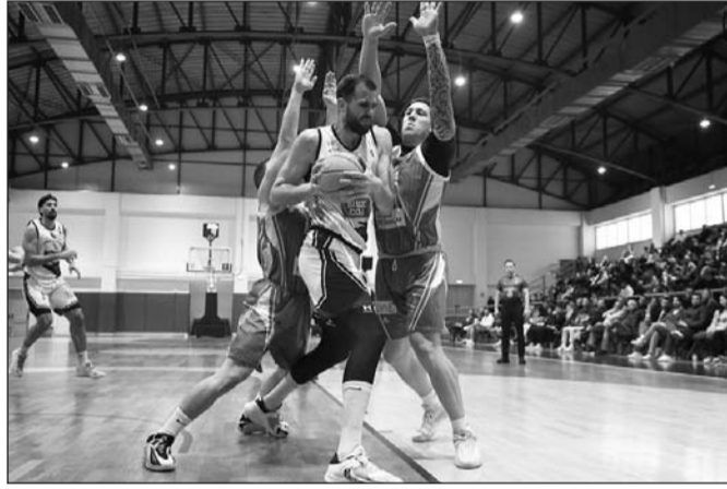
Στην πριζα ξανά οι πρωταγωνιστές Α2 Εθνικής

Κοντά σε όλα αυτά να προσθέσουμε και την αίσθηση ότι διακινούνται στον αγωνιστικό