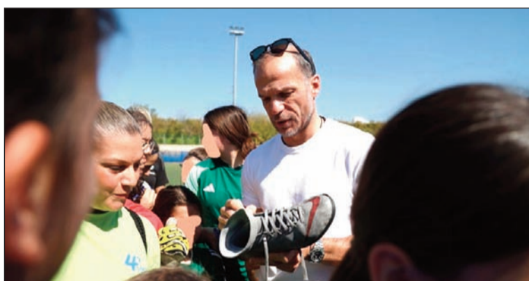
Ο πρωταθλητής Ευρώπης Άγγελος Μπασινάς είναι ο ambassador του FIFA Women's Football Campaign, το οποίο βροίσκεται σε εξέλιξη με φεστιβάλ ποδοσφαίρου για κορίτσια ανά την Ελλάδα

Σε αντίθεση με άλλα προγράμματα που επικεντρώνονται στην