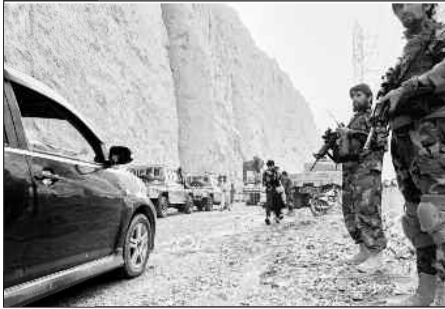
Ένας πλανήτης που γίνεται όλο πιο άγριος