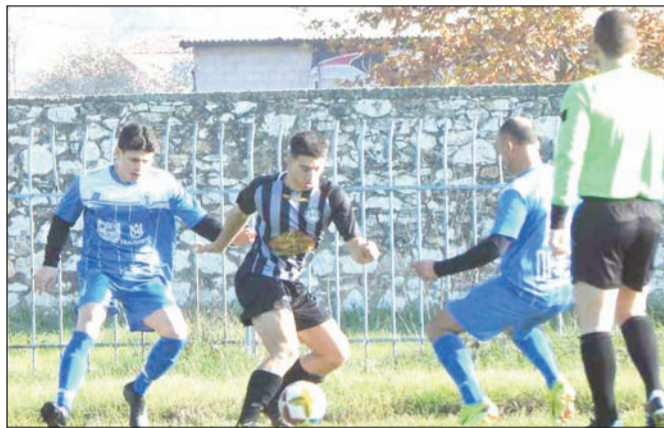
Το Μεγαλοχώρι θα φιλοξενήσει την ΑΕ Φαρκαδόνιων

Μπερντες Γηπ. Ασπροκκλησιας: Ασπροκκλησια - Πηγη Διατ. Κουτσαγιας Μακρης - Αβρααμ Ν Γηπ. Ασπροβαλτου: Ασπροβαλτος - Χρυσομηλια Διατ. Ανδριοπουλος Λαφαζανης - Μπαιρακταρης Γηπ. Βαλτινου: Βαλτινό - Φωτεινό Διατ. Μουστακας Κλουβατος - Δημητρελης Γοργογυριου Γοργογυρι - Αθλος Διατ. Δουλοπουλος Βουτσελας - Μαργιωλης Ρεπό: Πιαλεια.