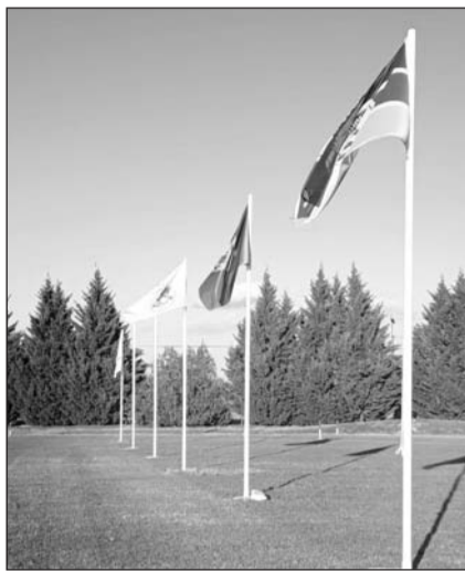
Το παγκόσμιο ανωμάλου ενόπλων δυνάμεων βήμα φιλόξενη στέγη στις Σκαμνιές

κού Πρωταθλήματος αναδεικνύει τη χώρα μας και την περιοχή μας, ως σημείο αναφοράς στον διεθνή στρατιωτικό αθλητισμό, προάγοντας τις αξίες της ευγενούς άμιλλας,