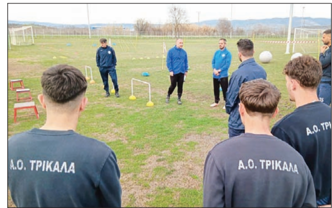
Ο ΑΟΤ θα επιδιώξει τη νίκη στη Νέα Σελεύκεια

σημειωθεί ότι, λόγω της περιορισμένης χωρητικότητας της αίθουσας, η διαδικασία θα διεξαχθεί χωρίς την πα-