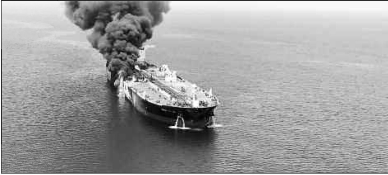
Η μάχη των τάνκερ