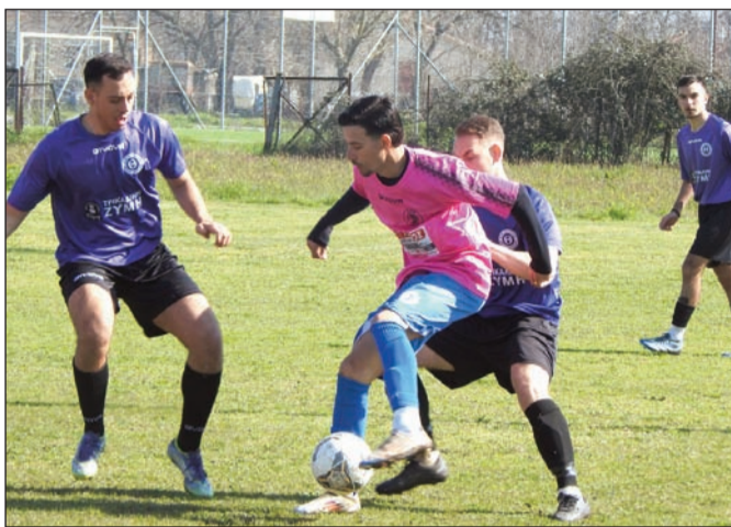
Το Μεγαλοχώρι θα παίξει στο Πετρωτό, ενώ η Α.Ε. Φαρκαδώνων θα φιλοξενήσει τους Αγίους Αποστόλους