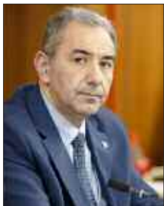
Δρ. Κωνσταντίνος Π. Μπαλωμένος

konmpalo@gmail.com Πολιτικός Επιστήμονας - Διεθνολόγος Πρώην Γενικός Διευθυντής - Γενικής Διεύθυνσης Πολιτικής Εθνικής Άμυνας και Διεθνών Σχέσεων (ΓΔΠΕΑΔΣ) Υπουργείου Εθνικής Άμυνας (ΥΠΕΘΑ)