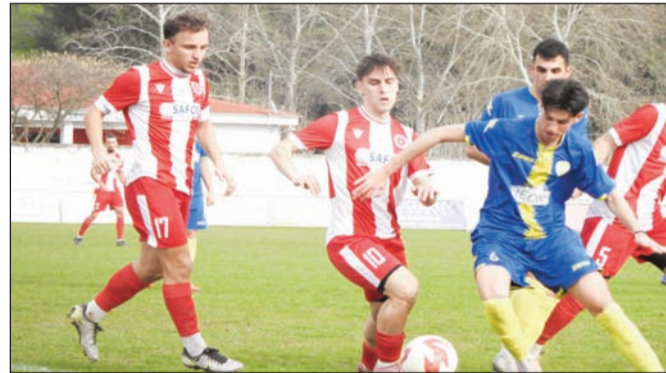
Τα Μετέωρα θα φιλοξενήσουν το Καστράκι στην Καλαμπακιώτικη αναμέτρηση, ενώ το Νεοχώρι θα κερδίσει στα χαρτιά τη Φήκη

Τα Μετέωρα θα φιλοξενήσουν το Καστράκι, ενώ το Νεοχώρι θα κερδίσει χωρίς αγώνα τη Φήκη