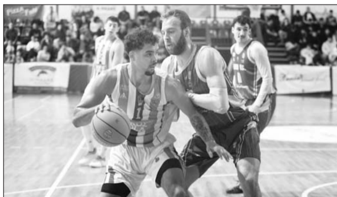
Πολλά σημεία αναφοράς και στην 25η αγωνιστική Α2 Εθνικής

Ομοιογενείς οι αθλητές έχουν τεράστια διάθεση για να εκτελέσουν όσο καλύτερα μπορούν την αποστολή που τους αναθέτει ο προπονητής. Φροντίζουν λοιπόν από τα