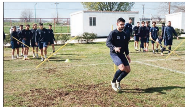
Για το εισιτήριο του τελικού θα παίξει αύριο ο ΑΟ Τρίκαλα απέναντι στον Εθνικό Κεραμιδίου

Ο ΑΟΤ φιλοξενεί αύριο τον Εθνικό Κεραμιδίου στον ημιτελικό του κυπέλλου Ερασιτεχνών