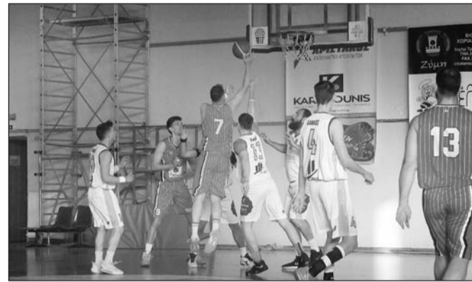
Κάθε τζάμπολ στην Α1 ΕΣΚΑΘ γεννά πολλές ελπίδες

Οι Δαναοί μετά τη νίκη στο ντέρμπι με την ΑΕΤ παίζουν