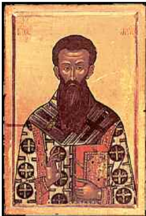
Γρηγόριος ο Παλαμάς. Τοιχογραφία παρεκκλησίου Μονής Διονυσίου, Αγίου Όρους, 15Τ' αιών.

ο Ευγενικός αναδείχθηκε ο "άτλας της Ορθοδοξίας" κατά τη ληστρική Σύνοδο Φερράρας-Φλωρεντίας, έτσι και ο αρχιεπίσκοπος Θεσσαλονίκης Γρηγόριος ο Παλαμάς με την Ορθόδοξη διδασκαλία του διέλυσε το δηλητηριώδες νέφος της κακοδοξίας του Βαρλαάμ του Καλαβρού και των