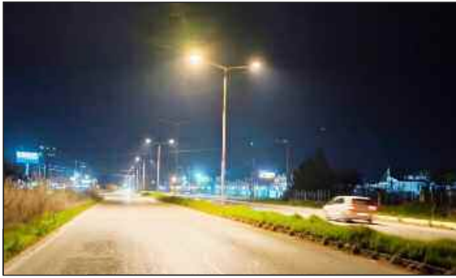
Φως, περισσότερο φως!