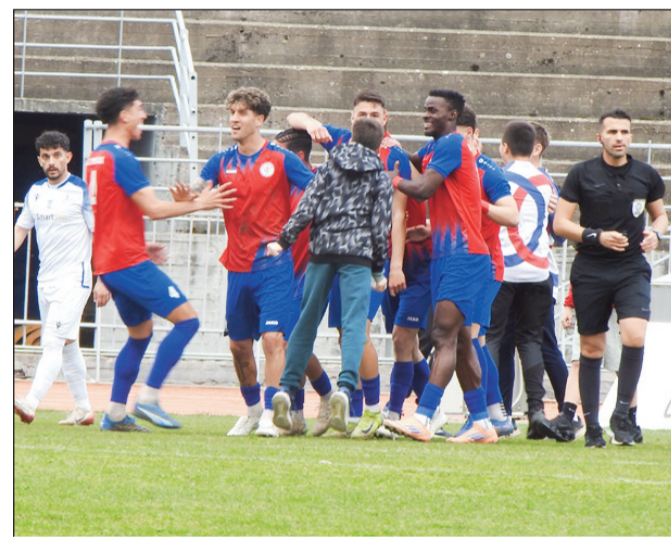
Πανηγυρισμοί από τους τρικαλινούς παίκτες για τη νίκη πρόκριση

κρούοντας το καλοχτυπημένο φάουλ του Γκίκα.