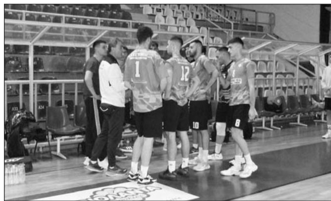
Με το σπαθί της η Αμιλλα πέτυχε τον στόχο

Με ανεβασμένη ψυχολογία η Τρικαλινή ομάδα επικράτησε και