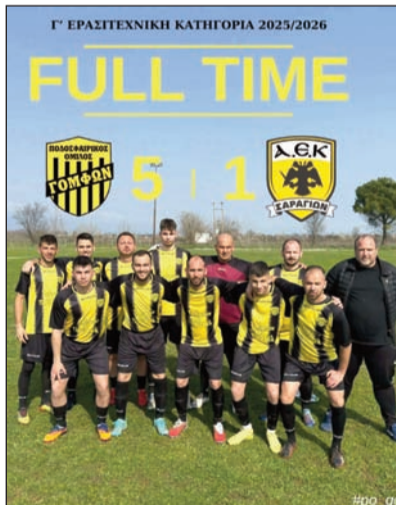
Οι Γόμφοι συνεχίζουν με το απόλυτο στην Γ' Ερασιτεχνική

2Η ΑΓΩΝΙΣΤΙΚΗ ΑΓΙΑ ΜΟΝΗ – ΕΛΕΥΘΕΡΟΧΩΡΙ 2-8 Κατσιμάνης, Παπαδήμας – Νιάρος [4], Κουσκουνάς [2], Τσιγάρας [2] ΑΟ ΤΡΙΚΑΛΑ Β' – ΠΑΛΑΙΟΠΥΡΓΟΣ 1-2 Α.Κωστόυλας – Θ.Μπράκης, Θ.Βασιλάκος ΓΟΜΦΟΙ – ΑΕΚ ΣΑΡΑΓΙΩΝ 5-1 Σ.Κακάβας [5] – Δ.Οικονόμου.