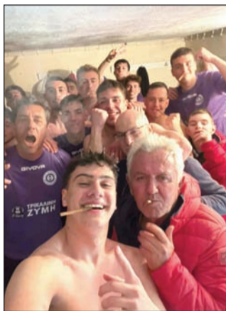
«Νάτοι νάτοι οι πρωταθλητές» φωνάζει από την περασμένη Κυριακή το Μεγαλοχώρι

Την δεύτερη θέση εξασφάλισαν τα Σαράγια στον 1ο όμιλο