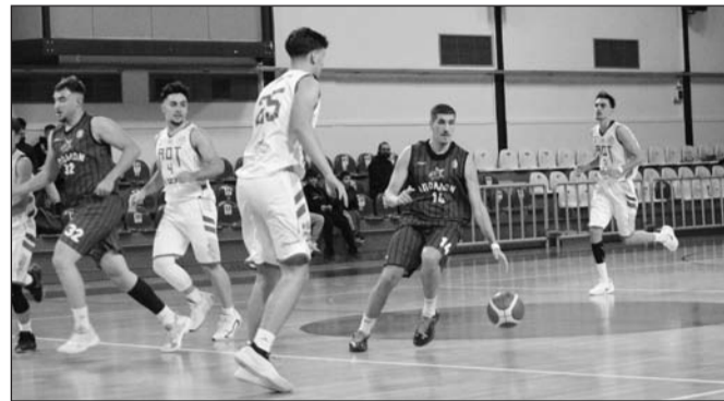
Μεγάλη ευκαιρία για υπέρβαση έχασε ο ΑΟΤ

αλλά ήλυσε στο τέλος 66-64 στον Απόδηλωνα. Κ- Νέα ήττα ΑΟΚ