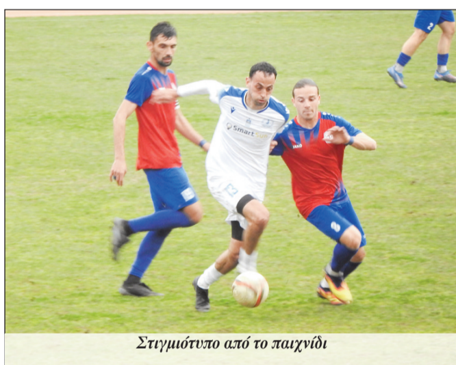
Στιγμιότυπο από το παιχνίδι