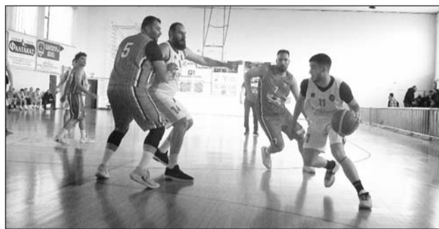
Δαναοί και ΑΕΤ προχώρησαν με ροζ φύλλα

Καθ' όλη την διάρκεια της εβδομάδας τα επιτελεία των συλλόγων προβαίνουν σε εμπειριστάτων δουλειά και προετοιμασία.