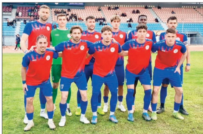
Η ομάδα του Α.Ο Τρίκαλα ξεκίνησε «εκρηκτικά» το πρώτο ημίχρονο και δικαιώθηκε

Στο 93' ο Λαζαρίνας έσωσε και πάλι την εστία του απο-