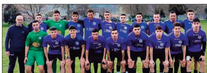
Η ομάδα του Μεγαλοχωρίου έκοψε το νήμα του τεματισμού και η τελευταία αγωνιστική δεν έχει βαθμολογικό ενδιαφέρον