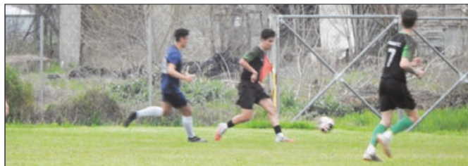
Στιγμιότυπο από τον αγώνα Ριζαριό- Σαράγια

ΑΚΑΔ.ΦΑΡΚΑΔΟΝΑΣ – ΑΓ.ΑΠΟΣΤΟΛΟΙ .....1-2 Κούβαρης – Χρήστου, Τσιγαρίδας ΑΧΙΛΛΕΑΣ ΜΠΑΡΑΣ – ΜΙΚΡΟ ΚΕΦ. ....2-2 Λ.Μπαούσης [2] – Κυριαζής [2] ΡΙΖΑΡΙΟ – ΣΑΡΑΓΙΑ .....1-4 Καλιακούδας – Μπαρέκας [2], Στρατίκης, Ντόνας ΠΕΤΡΩΤΟ – ΜΕΓΑΛΟΧΩΡΙ...0-3