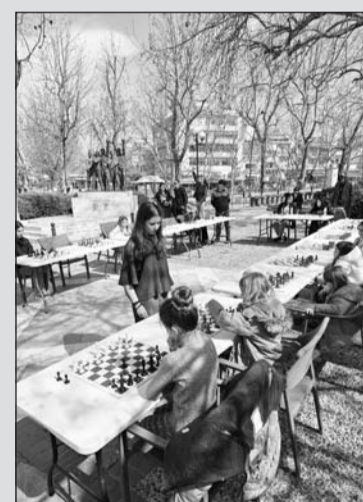
Ξεχωριστή δράση από την ΣΚΑΚΙ και σε πολλά ακόμη μέτωπα

Η Περιφέρεια Θεσσαλίας Επίσημος Συνδιοργανωτής του 9ου Πανευρωπαϊκού Πρωταθλήματος Kyokushin Budokai.