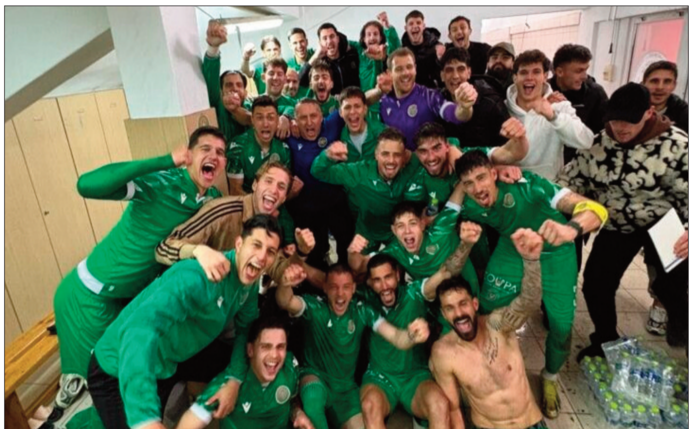
Στο δρόμο της τρικαλινής ομάδας ο φορμαρισμένος Πανθρακικός, «πρωταθλητής» στον Α' όμιλο της Γ' Εθνικής

κυρας, 37. ΑΕ Λευκίμμης Κέρκυρας, 38. Καστοριά.