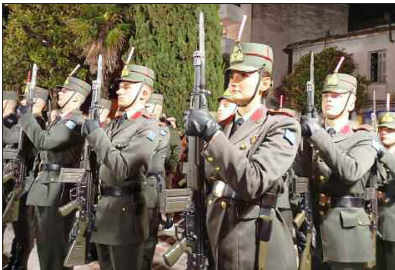
Οι σπουδαστές της ΣΜΥ με το δικό τους τρόπο είπαν το Χριστός Ανέστη!