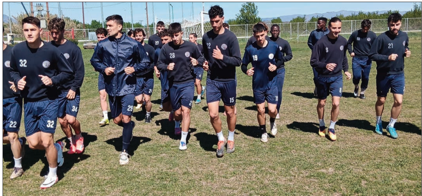
Ο τελικός και μόνο ο τελικός του κυπέλλου ερασιτεχνών θα πρέπει να βρίσκεται στο στάδιο των παικτών του ΑΟΤ

28. Πρωταθλητής ΕΠΣ Θεσπρωτίας, 29. Αρης Φιλατιών Θεσπρωτίας, 30. Πρωταθλητής ΕΠΣ Πρέβεζας/Λευκάδας, 31. Τηλυκράτης Λευκάδας, 32. Πρωταθλητής ΕΠΣ Αρτας (Ανέζα), 33. Αναγέννηση Αρτας, 34. Πρωταθλητής ΕΠΣ Ηπείρου, 35. ΠΑΣ Γιάννινα, 36. Πρωταθλητής ΕΠΣ Κέρ-