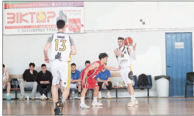
Μεγάλη προσοχή στην τελική ευθεία της Α1 ΕΣΚΑΘ

Συνδύασαν μάλιστα ηχηρά αποτελέσματα και καλό μπά-