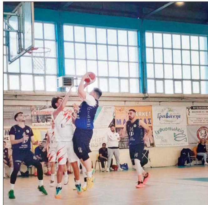
Η Α2 ΕΣΚΑΘ γοήτευσε αρκετούς φιλάθλους στην φετινή διαδικασία

Με την συγκεκριμένη τους φράση θέλουν να δείξουν τον