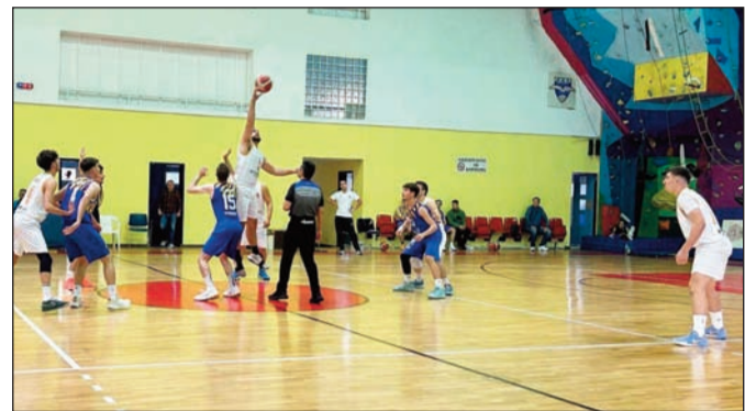
Η φρεσκάδα στην τελική ευθεία κρίνει στοιχήματα

Γενικά παρατηρείται στροφή στην βελτίωση της φυσικής κα-