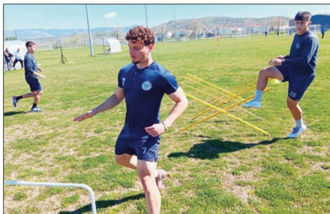
Οι παίκτες του ΑΟΤ προετοιμάζονται για τον τελικό