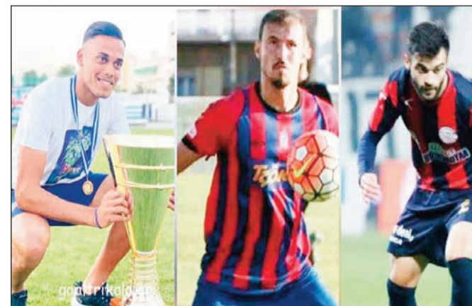
Αρκετοί παίκτες που έχουν περάσει από τον ΑΟΤ θα παίξουν στην γα φάση του πρωταθλήματος