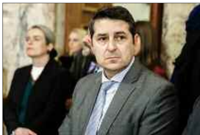
ανέφερε πως ο κ. Μυλωνάκης υπεβλήθη σε εμβολισμό του θρόμβου που προκάλεσε το ανεύρυσμα και αυτή τη

στιγμή είναι διασωληνωμένος στη ΜΕΘ. «Σήμερα το πρωί περί τις 9:30 διακομίστηκε με ασθενοφόρο του ΕΚΑΒ στο νοσοκομείο Ευαγγελισμός μετά από έντονη αδιαθεσία και λιποθυμικό επεισόδιο ο υφυπουργός παρά τω πρωθυπουργό, Γιώργος Μυλωνάκης. Έγιναν όλα οι απαραίτητες εξετάσεις. Αυτή τη στιγμή η κατάστασή του θεωρείται σοβαρή, αλλά ελεγχόμενη», είπε ο διοικητής.