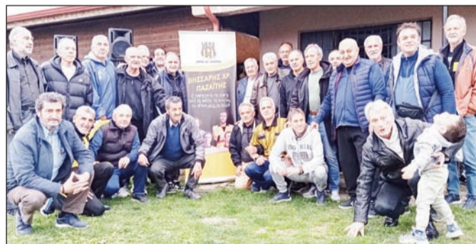
Στιγμιότυπα από την εκδήλωση