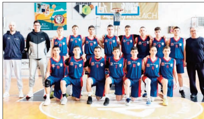
Οι Θεσσαλικές μπασκετικές μικτές ετοιμάζονται για γιορτή

Είναι εμφανής η αγάπη των ταλέντων για το άθλημα που