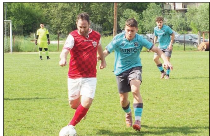
Συγκινήσεις πρόσφεραν χθες ΑΕΤ και Δήμητρα