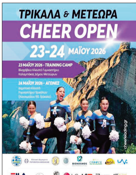
Στα αθλητικά Τρίκαλα θα χτυπήσει η καρδιά του Cheerleading

Η καρδιά του ελληνικού Cheerleading θα χτυπά δυνατά στη Θεσσαλία το διήμερο 23 και 24 Μαΐου 2026. Για πρώτη φορά, η πόλη των Τρικάλων θα φιλοξενήσει το Πανελλήνιο Πρωτάθλημα του Cheerleading Ζευγαριών, ενώ παράλληλα θα διεξαχθεί το εντυπωσιακό Τρίκαλα & Μετέωρα Cheer Open 2026.