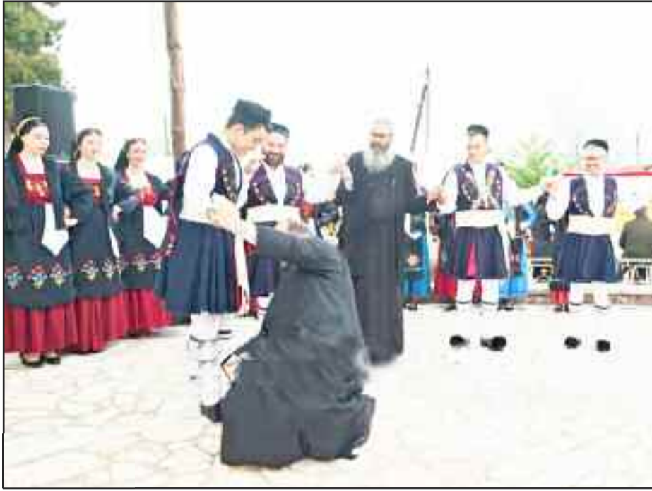
Η Λαμπρή φέρνει πάντα κέφι!