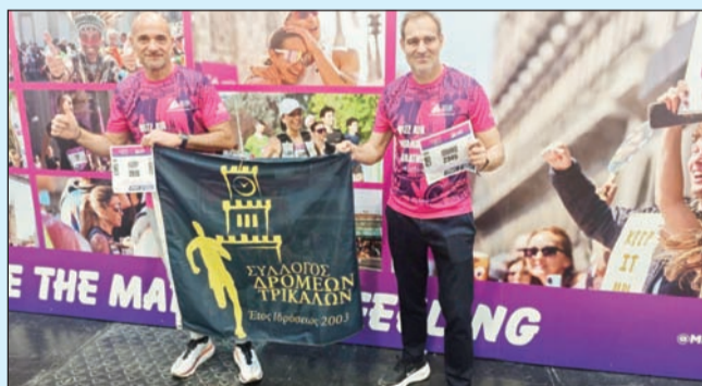
Το δίδυμο του Συλλόγου δρομέων έτρεξε στον μααραθώνιο του Μιλάνο

Παίζουν στα δάχτυλα τις εγχώριες διοργανώσεις στις οποίες μετέχουν δυναμικά και επιστρέφουν με γεμάτα χέρια.