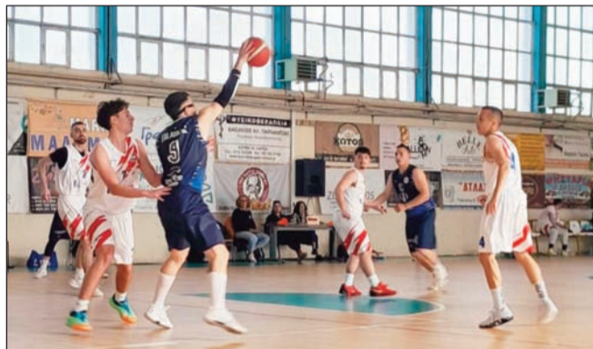
Ξεχωριστή βαρύτητα για πολλούς λόγους έχουν οι αγώνες ντέρμπι