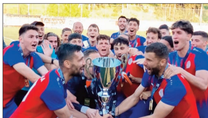
Πανηγυρίζοντας με το τρόπαιο