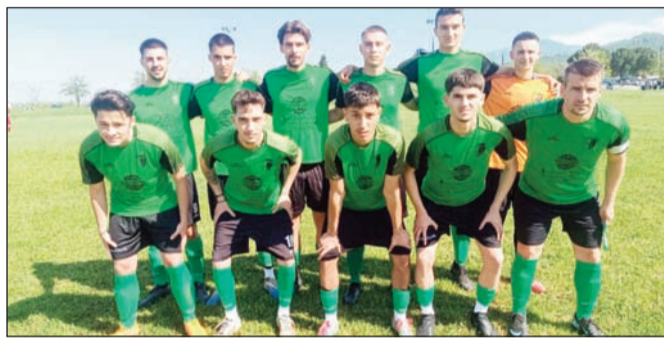
Τα Σαράγια διεκδίκησαν μέχρι την τελευταία λεπτά την άνοδο, αλλά δεν τα κατάφεραν

Στο 18' ο Περνέζα, δοκίμασε το πόδι του πίσω από το κέντρο αλλά ο Βράντζας με διπλή