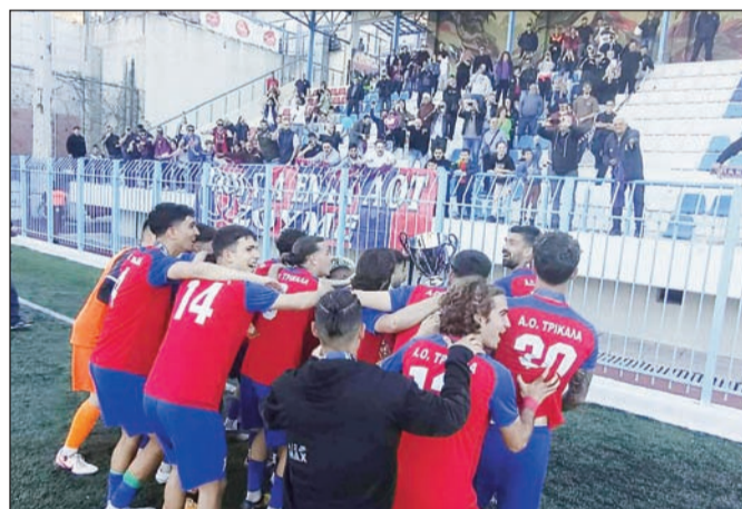
Αφιέρωση στους φιλάθλους που βρέθηκαν στη Θεσσαλονίκη

Γκουτσιδη και ασταθή απόκρουση του Λαζαρίνα ο Λαρέα δεν μπόρεσε να σκοράρει.