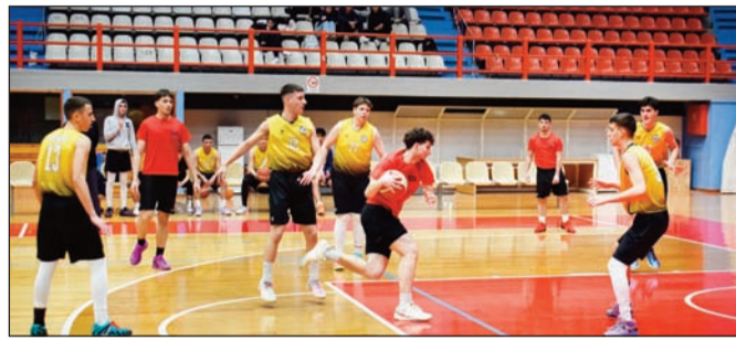
Πολλές φορές χρειάζεται ατέλειωτο τρέξιμο για διεκπεραίωση της χρονιάς

Ασφαλώς κάποιοι ιθύνοντες λυγίζουν αφού δεν βλέπουν και τους κατάλληλους συμπαρασάτες.