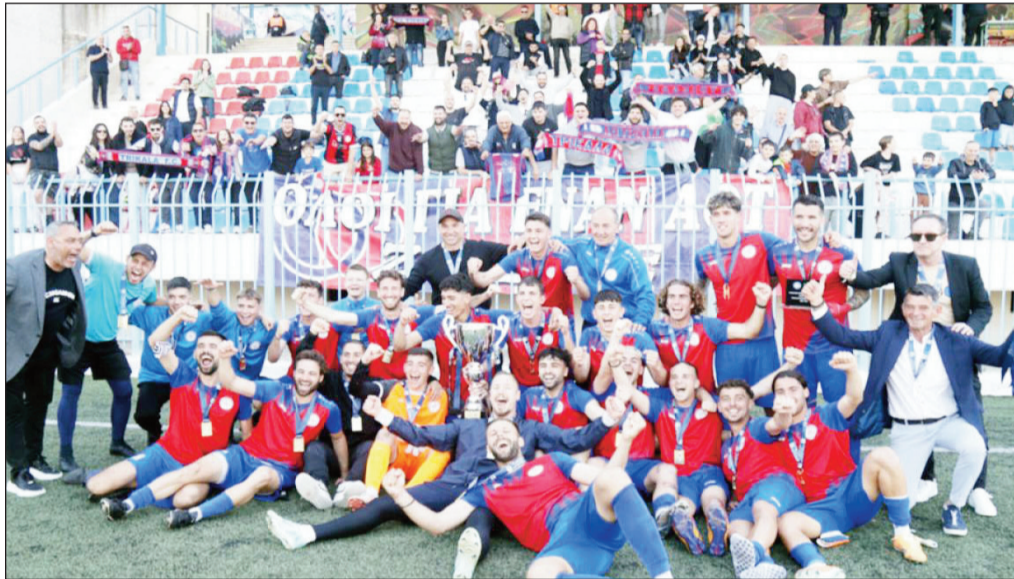
Κυπελλούχος Ερασιτεχνών 2025-2026 ο ΑΟ Τρίκαλα

Ο ΑΟ Τρίκαλα κέρδισε 2-1 τον Πανθρακικό και επέστρεψε με την κούπα