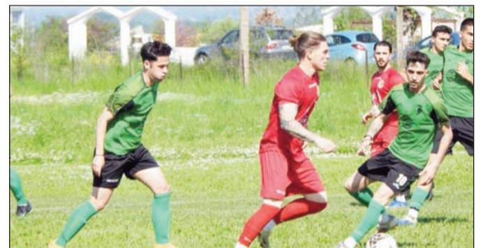
Στιγμιότυπο από το μπαράζ ανόδου