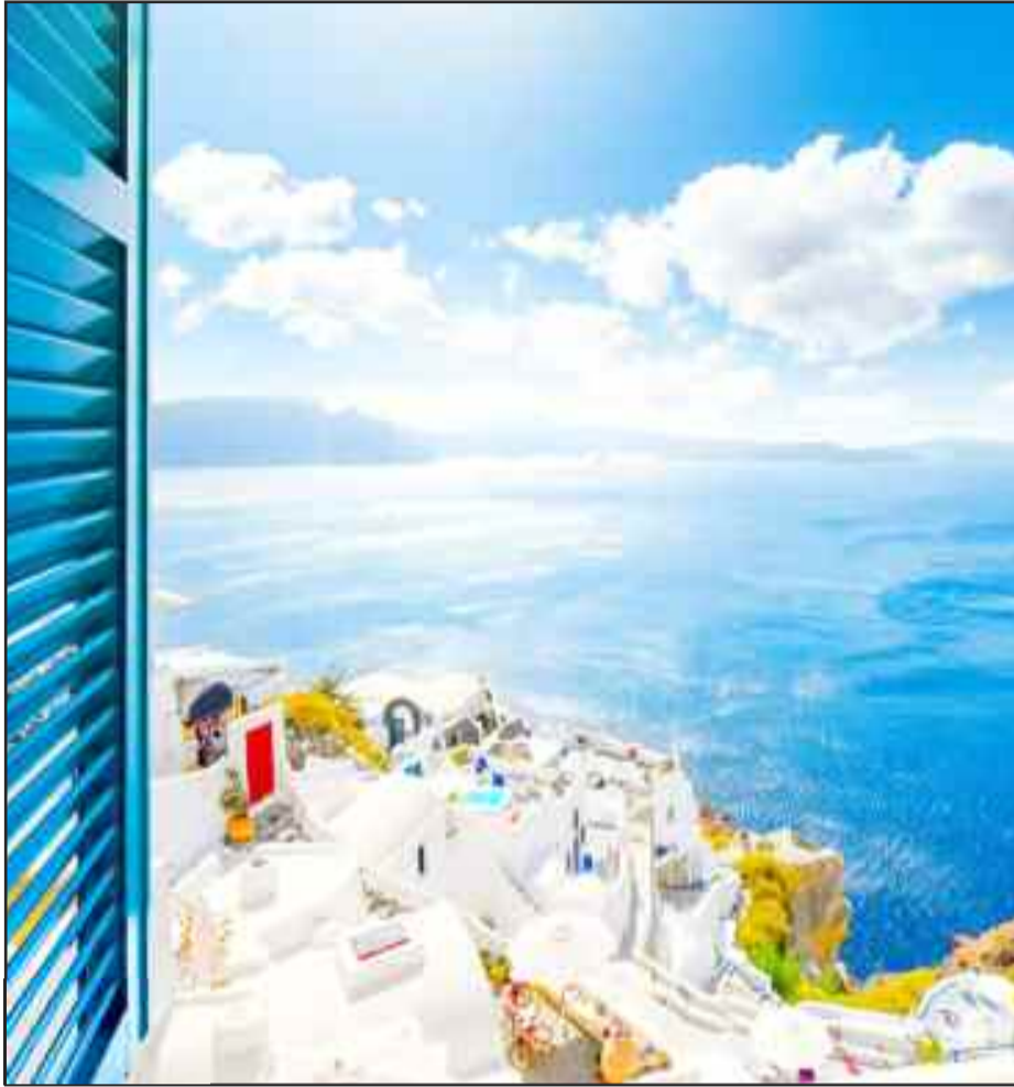
Δίνουμε... ιδέες για το καλοκαίρι!