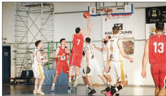
ΑΕΤ και Δαναοί βλέπουν τους κόπους τους να καρποφορούν

Δαναός 2022: (Μπάλτος) Κωτούλας 4, Πιτσαρης 10(1), Μπακάλης 3, Ντόβας 11(1), Σδράκας 20(2), Φίλος 8, Ζησόπουλος 2.