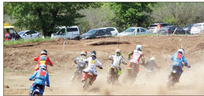
Χορταστικός ο Κυριακάτικος αγώνας μύτο κρος.

Ορισμένα πράγματα είναι άλλο να στο λένε και διαφορετικό να τα βλέπεις από μέσα.