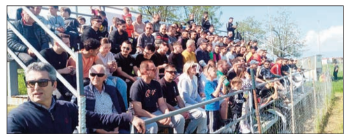
Γεμάτη η κερκίδα από κόσμο αλλά και η περιήφραξη του γηπέδου, ελαμψαν με την απουσία τους «επόνυμα» πρόσωπα