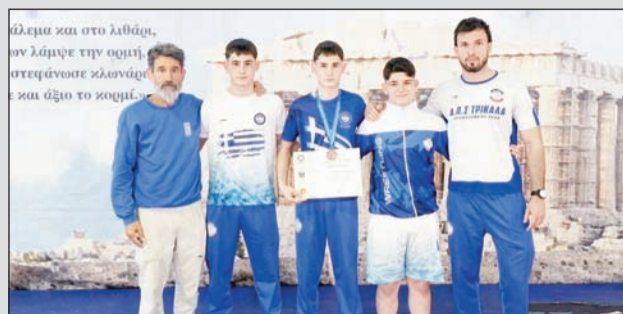
Πολυφωνικές παρουσίες ΑΠΣΤ σε διάφορες εκδηλώσεις

Σε πολλά μέτωπα παίζει αυτή την εποχή ο ΑΠΣΤ με το νέο του αίμα να ξεχωρίζει στις συνάξεις που λαμβάνει μέρος.