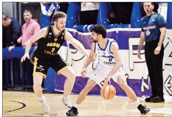
Τα εθνικά πρωταθλήματα μπάσκετ αποτελούν πηγή έμπνευσης

Πράγματι υπήρξαν στιγμές που έκρυσαν την μπάλα. Όμως στο διάβα του χρόνου κινήθηκαν σε πιο ρηχά νερά για πολλούς και διαφόρους λόγους.