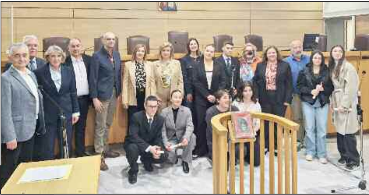
Οι νομικοί του μέλλοντος