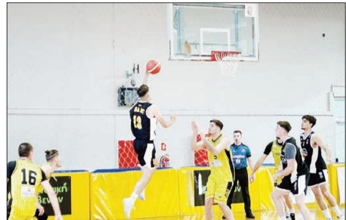
Τρικαλινές εμπνεύσεις σε μπασκετικές διοργανώσεις μακράς διάρκειας

στικούς χώρους ξέρουν πολύ καλά ότι η καθαρή ματιά παίζει τεράστιο ρόλο στις συναντήσεις δίχως αύριο.