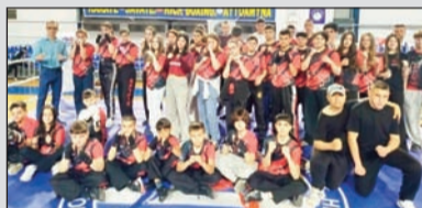
Άρσε πολύ το διασυλλογικό s boxe savat του Θεσσαλού

Ο χρόνος κύλησε σαν νεράκι με τον έναν αγώνα να είναι καλύτερος από τον άλλο. Η εκδήλωση διοργανώθηκε από την Ελληνική Ομοσπονδία Σαβάρ, σε συνεργασία με τον ΑΣΚ Θεσσαλός, τον Δήμο Τρικαλιών και την Περιφερειακή Ενότητα Τρικάλων, στο Δημοτικό Κλειστό Τρικάλων. Η διοργάνωση στέφθηκε με επιτυχία, προσφέροντας δυνατές αναμετρήσεις και υψηλό επίπεδο αγωνιστικότητας. Στους αγώνες συμμετείχαν αθλητές από συλλόγους των Τρικάλων, της Καρδίτσας, της Λάρισας, του Βόλου, της Λαμίας, της Καστοριάς, της Καλαμπάκας, της Θεσσαλονίκης, αλλά και από την Κω, αποδεικνύοντας τη μεγάλη απήχηση του αθλήματος σε όλη τη χώρα.