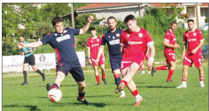
Εμβόλιμη αγωνιστική η σημερινή με το Νεοχώρι να φιλοξενεί το Πρίνος

Γηπ. Παλαιομ/ρου: Διατ. Λεωνίδας Μουστακάς - Αβραάμ Ν Μετέωρα - Φήκη 3-0 α.α