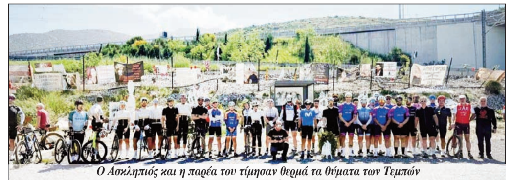
Ο Ασκληπιός και η παρέα του τίμησαν θεμά τα θύματα των Τεμπών

Ο πόνος της απώλειας είναι ακόμη βουβός και βαθύς, ενώ έχει συγκλονίσει και την αθλητική κοινότητα. Έτσι ο ΠΑΣ. Ασκληπιός και οι φίλοι του ποδηλάτου έδωσαν υπόσχεση ότι θα τιμούν σε πρώτη ευκαιρία με τον δικό τους τρόπο την μνήμη των θυμάτων των Τεμπών.