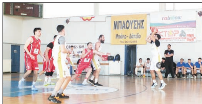
Δαναοί και ΑΕΤ βλέπουν πλέον την πρόκληση των πλέϊ οφ

τήριο που ήρθε μετά την καθάρη νίκη 98-83 επί του ομογάλακτου ουσιαστικά Δαναού 22.