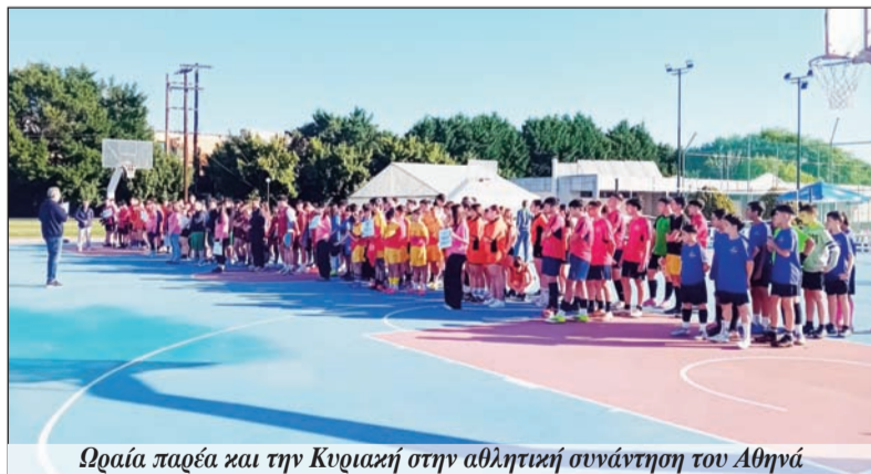
Όραία παρέα και την Κυριακή στην αθλητική συνάντηση του Αθηνά

Επίσημο δελτίο θα ακολουθήσει σε επόμενο φύλλο.