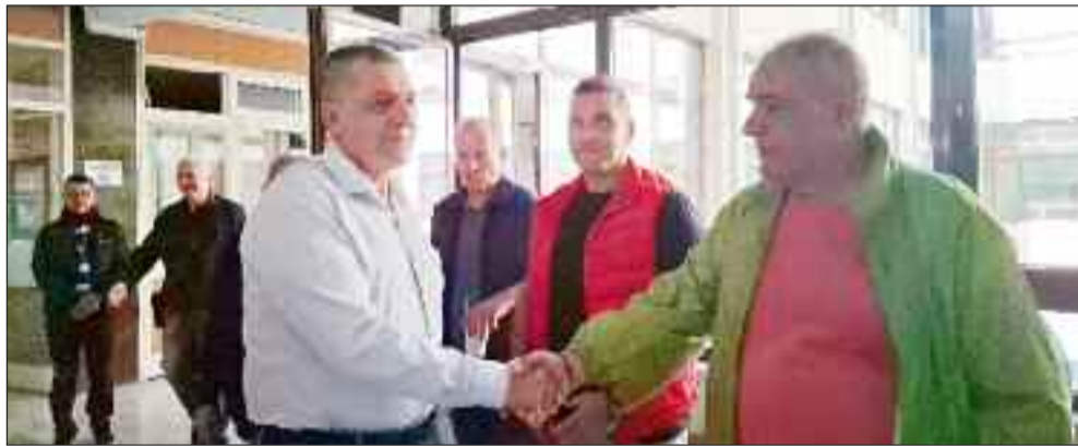
Φωτογραφικά στιγμιότυπα από την επίσκεψη του Περιφερειάρχη

ότι παρέλαβε τη σχετική μελέτη από το Υπουργείο Προστασίας του Πολίτη.