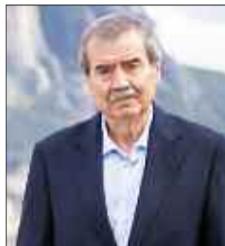
Γράφει ο Κώστας Πρεβένιτης, Σύμβουλος Πολιτικής Σύνθεσης Δήμου Μετεώρων

λον, όταν σέβεται τη μειοψηφία, όταν υπηρετείς το κοινό συμφέρον υπεράνω του προσωπικού! Μαθαίνεται μέσα από τη συνεργασία, τον συμβιβασμό, την ευθύνη απέναντι στο σύνολο.