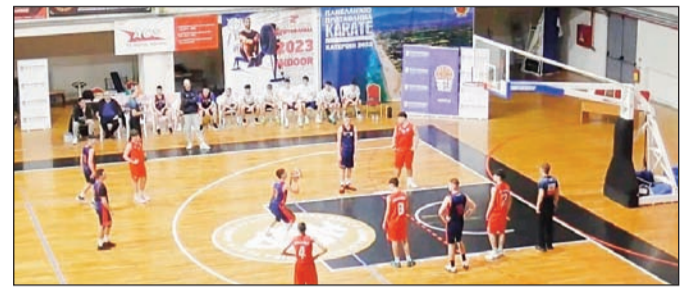
Ο συνδυασμός στοιχείων μπορεί να φέρει εκρηκτικά αγωνιστικά αποτελέσματα

Με όλα αυτά τα περιθώρια χαλάρωσης είναι ελάχιστα αλλά όταν ανοίγει η κάνουλα των επιτυχιών οι πρωτεργάτες ξεχνούν τα πάντα βιώνοντας μοναδικά συναισθήματα.