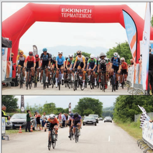
Τα ποδηλατικά νιάτα πρόσφεραν μοναδικές εικόνες σε Τρικαλινές γωνιές

Οι συμπολίτες έχουν την ποδηλασία στο αίμα τους και το απέδειξαν για μια ακόμη φορά οργανωτικά και αγωνιστικά.