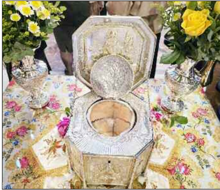
Οι τρικαλινοί και φέτος ασπίαστηκαν την Τιμία Κάρα του Αγίου Βησσαρίωνα