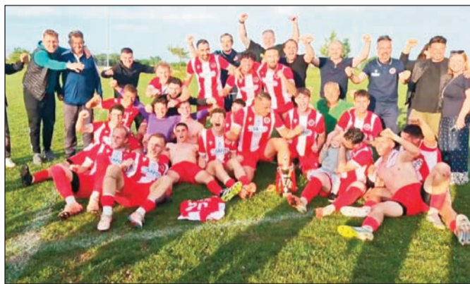
Ο ΑΟΤ συγχαίρει τον Διγενή Νεοχωρίου για την άνοδο