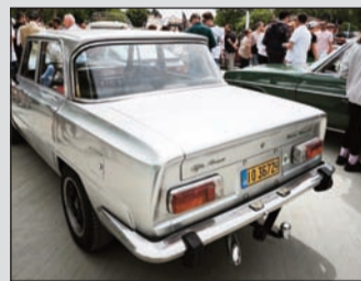
Τα κλασικά οχήματα κέρδισαν τους πάντες στον μύλο Ματσόπουλου

Μπορεί η τεχνολογία να έχει απογειώσει τα αυτοκίνητα αλλά οι εραστές του είδους έχουν στην καρδιά τους τα κλασικά οχήματα. Ετσι τίμησαν μια ξεχωριστή πρωτοβουλία με το παραπάνω. Πέρα από τις δικές μας σκέψεις να παραθέσουμε και ανάλογες από το trikalaidées.