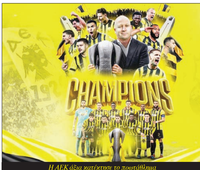
Η ΑΕΚ άξια κατέκτησε το πρωτάθλημα

στο Καραϊσκάκης ανάμεσα στον Ολυμπιακό και τον ΠΑΟΚ για την 4η αγωνιστική των playoffs της Super League. Το αποτέλεσμα αυτό σε συνδυασμό με τη νίκη της ΑΕΚ επί του Παναθηναϊκού έδωσε το πρωτάθλημα στην Ένωση, δύο αγωνιστικές πριν από το φινάλε. Στην δεύτερη θέση είναι ο Δικέφαλος με 62 πόντους, έχοντας πάρει την ισοβαθμία από τους Πειραιώτες που είναι 3οι με τους ίδιους βαθμούς. Οι Πειραιώτες μπήκαν μπροστά στο σκορ με κεφαλιά του Ροντινέι στο 61ο λεπτό, έπειτα από γέμισμα του Έσε. Οι ασπρόμαυροι κατάφεραν να απαντήσουν στο 69ο λεπτό με τον Κωνσταντέλια να σκοράρει από κοντά έπειτα από