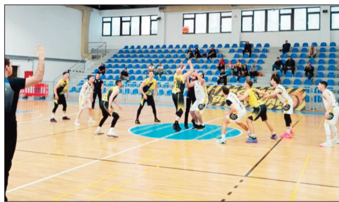
Οι Δαναοί δεν γύρισαν το παιχνίδι με την Αγριά

Ο εκπρόσωπός μας αν και είναι στο πνεύμα των αγώνων δεν έχει καταφέρει να φτάσει στο πολυπόθητο κλειδίωμα, οπότε ο έμπειρος αντίπαλος