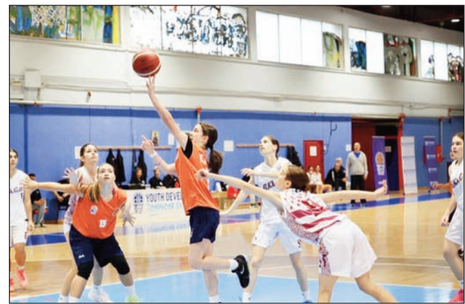
Όσοι επενδύουν στην αθλητική γνώση αυξάνουν τις πιθανότητες επιτυχίας

Ο καθένας αντιλαμβάνεται ότι η ανταλλαγή απόψεων συντελεί καθοριστικά στην διαμόρφωση μιας ισχυρής αθλητικής ταυτότητας.