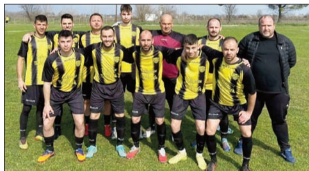
Οι Γόμφοι έχουν εξασφαλίσει την άνοδο τους

Ένα εισιτήριο άνοδου απομένει. Γόμφοι, Ελευθεροχώρι και ΑΟΤ Β' στο τρένο της άνοδου