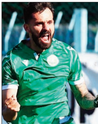
Ο Πανθηρακικός πήρε το εισιτήριο άνοδου στην Super League 2

Ο Πανθηρακικός πανηγύρισε την εξασφάλιση της άνοδου του στη Super League 2. Οι Θρακιώτες επικράτησαν 5-1 της Ελασσόνας και έφτασαν στους 12 βαθμούς, δύο αγωνιστικές πριν από το φινάλε της 3ης φάσης της Γ' Εθνικής. Κοντά στην άνοδο από τον Α' όμιλο και ο Απόλλωνας Καθαμαριάς, ο οποίος πέρασε το εμπόδιο του Εθνικού Κεραμιδίου, παίρνοντας τη νίκη με 3-2.