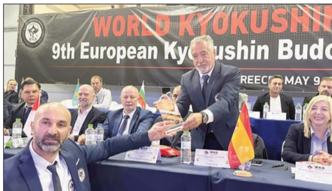
Άλλο επίπεδο στο Πανερωπαϊκό Kyokushin Karate