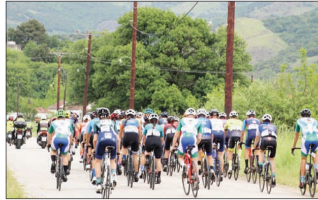
Κλασικές αξίες και όχι μόνον φτιάχνουν ελκυστικό αθλητικό κάρφο

Εννοείται ότι οι συμπολίτες με την τελειομανία τους δεν θέλουν να δώσουν το παραμικρό δικαίωμα.