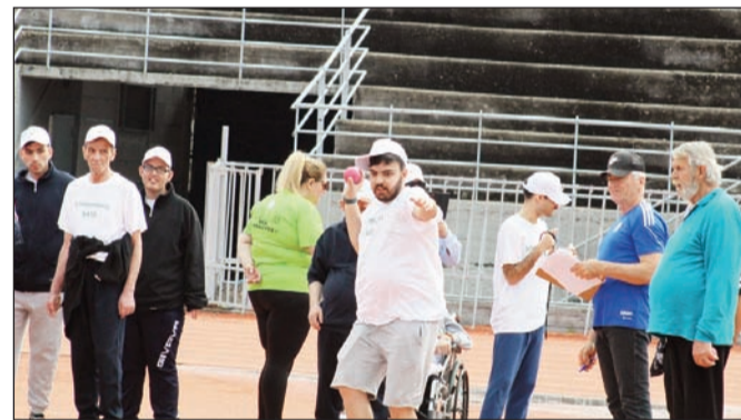
Μοναδικές εικόνες δύναμης και ψυχής στους πρόσφατους Πανθεσσαλικούς αγώνες ατόμων με αναπηρία