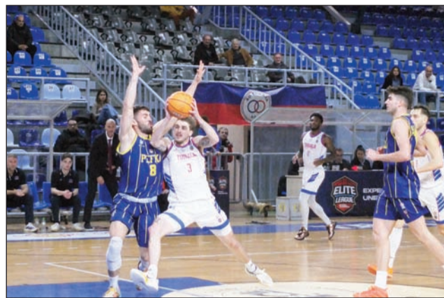
Ψάξιμο αλλά και σειρά μπάσκεττικών κινήσεων αναμένονται το επόμενο διάστημα

Αντίθετα όσοι επιχειρήσαν να γράψουν ιστορία βασιζόμενοι αποκλειστικά στο ατομικό ταλέντο διαπίστωσαν σύν-