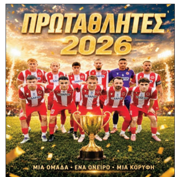
Το Νεοχώρι θα γιορτάσει τον τίτλο με τον δικό του τρόπο