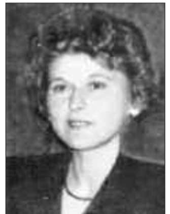
Γράφει η Μαργαρίτη Σταυρούλα Μεγάλα Καλύβια