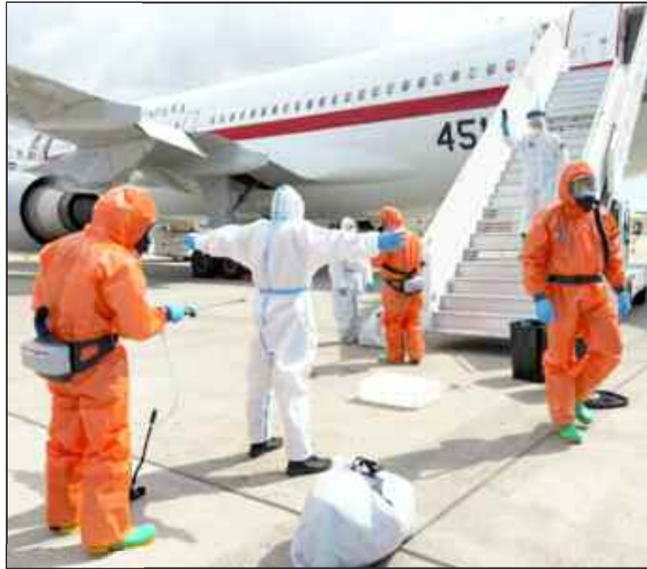
Άντε πάλι από την αρχή!