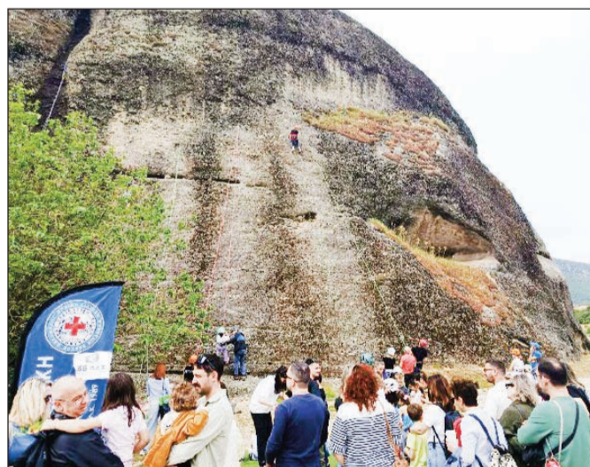
Ολοκληρωμένο πακέτο στο 2ο φεστιβάλ αναρρίχησης

περιβάλλον, δοκιμάζοντας τις δυνατότητές τους στις αναρριχτικές διαδρομές του πάρκου. Εγιναν και παράλληλες δραστηριότητες, όπως το zipling και το slackline, που χάρισαν ατελείωτες στιγμές διασκέδασης και αδρεναλίνης στους συμμετέχοντες. Παράλληλα, τα παιδιά συμμετείχαν με χαρά σε δημιουργικές και βιωματικές δράσεις, όπως το εργαστήριο «Εμείς και ο Κόσμος», με κατασκευές από βρώσιμα υλικά και πολλές ακόμη ευχάριστες εκπλήξεις. Το Αναρριχτικό Πάρκο Σαρακήνας γέμισε χαμόγελα, ζωντάνια και παιδικές φωνές, επιβεβαιώνοντας πως το Φεστιβάλ Αναρρίχησης έχει πλέον καθιερωθεί ως ένας σημαντικός θεσμός για την περιοχή, προάγοντας τον αθλητισμό, την ψυχαγωγία και την αγάπη για τη φύση. Ο Δήμος Μετεώρων και η Ορειβα-