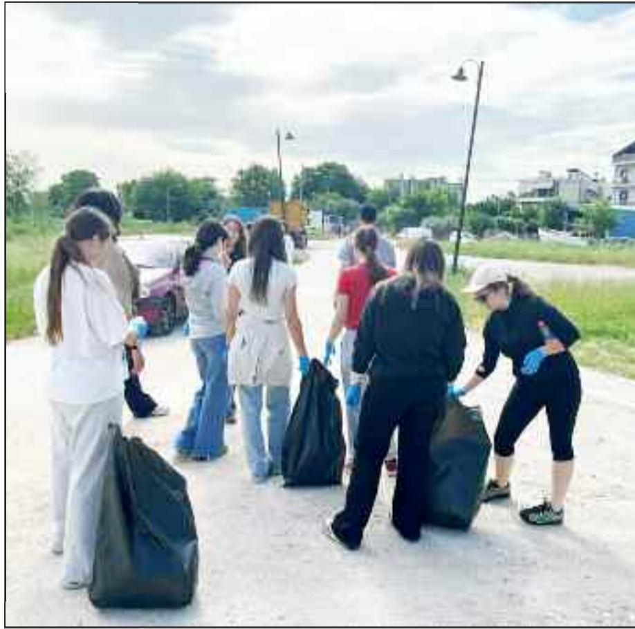
Διότι είναι σπουδαίο μάθημα και η προστασία του περιβάλλοντος