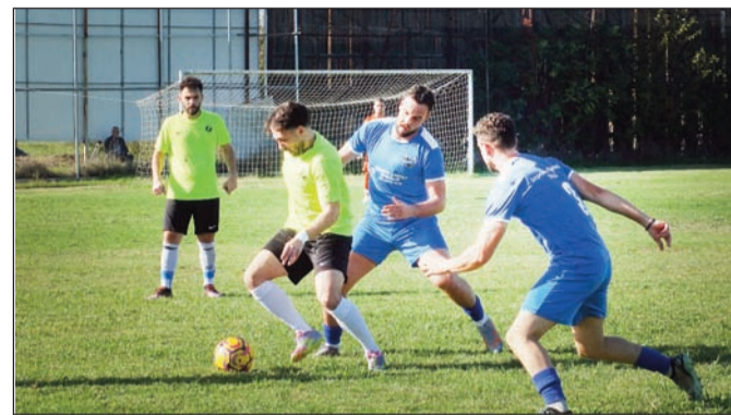
Πληθώρα εικόνων πρόσφερε η φετινή Α' Ερασιτεχνική

Οι λάτρεις του είδους εκτίμησαν ιδιαίτερα το πάθος και το φιλότιμο των παικτών. Επίσης μέτρησε και το γόητρο