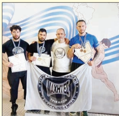
Οι Μαχητές έβαλαν υπογραφή στο Πανελλήνιο Παγκρατίου

Το Δ.Σ του συλλόγου συχαίρει τους Αθλητές για την επιτυχία τους και την ενσωμάτωσή τους στην Εθνική Ομάδα όπου θα συμμετέχουν στο Παγκόσμιο Πρωτάθλημα.