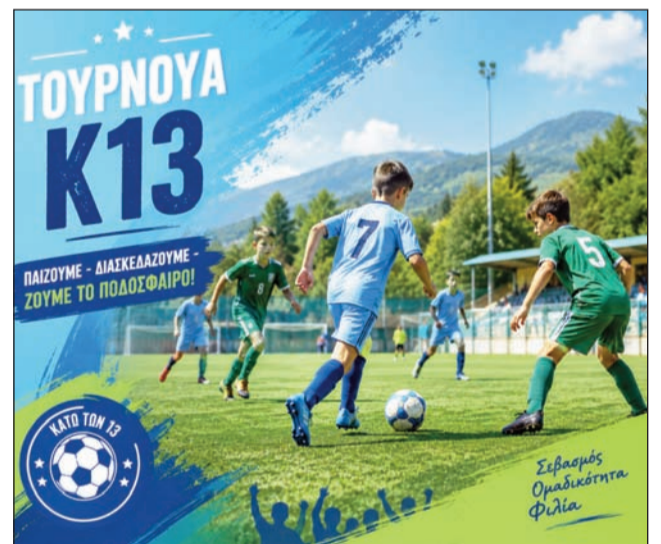
Ελκυστικό τουρνουά για τις ηλικίες Κ13 ανακοίνωσε η ΕΠΣΤ

κια του [τουρνουά, event] θα καθοριστεί από τον αριθμό των αθλητών που θα προσέλθουν. ΥΠΟΣΗΜΕΙΩΣΗ 2: Θα γίνει αξιολόγηση των παιδιών προκειμένου να σχηματισθεί μία πρώτη εικόνα για την στελέχωση της Μικτής Ομάδας Κ14 της