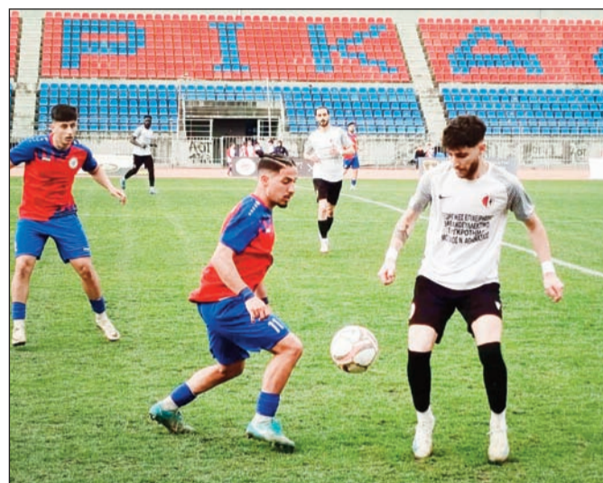
Ανοιγμα χαρτιών για την συμμετοχή νεαρών παικτών στην Γ' Εθνική

«Η μεγάλη αλλαγή αφορά το πρόγραμμα «Αναγέννηση», όπου βρισκόμαστε στον δεύτερο χρόνο. Στόχος μας είναι να περάσουμε γενική αλλαγή νοοτροπίας και φιλοσοφίας