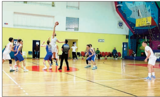
Αντοχή και καθαρό μυαλό χρειάζονται τα πλέϊ οφ

Τι να πει κανείς για τους εμπειρους αθλητές οι οποίοι πα-