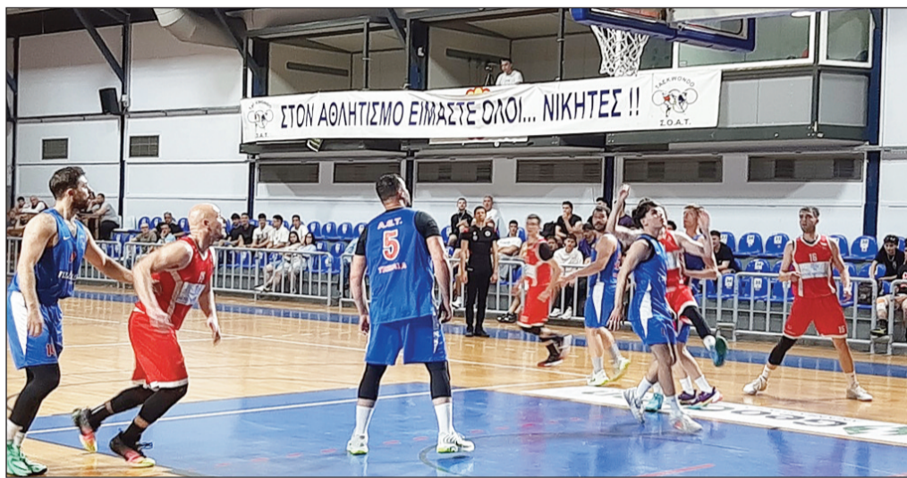
Η ΑΕΤ δεν έκανε την υπέρβαση κόντρα στον Ολυμπιακό. Β

Πλέον, ο Ολυμπιακός Βόλου περιμένει να μάθει τον αντίπαλό του στους τελικούς, ο οποίος θα προκύψει από το ζευγάρι ΓΣ Αγριάς - Δαναοί Τρικάλων(Σάββατο 18.00), με τη σειρά να βρίσκεται στο 2-2 και το πέμπτο παιχνίδι να αναμένεται με μεγάλο