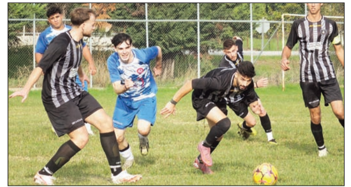
Ο αθλητισμός αποτελεί δυνατό Τρικαλινό χαρτί

Ειδικά στις μέρες μας μεγάλο ρόλο παίζει και η κοινωνική προσφορά. Στο πλαίσιο αυτό οι ιθύνοντες των τοπικών συλλόγων ενεργούν με σύστημα ούτως ώστε να μιλήσουν στην καρδιά