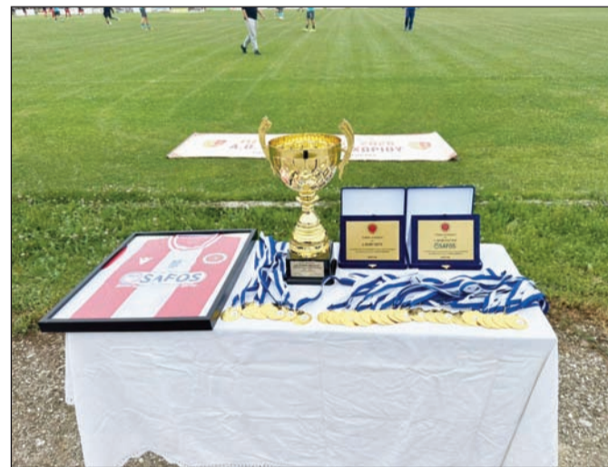
Το Νεοχώρι, μετά την δύσκολη κατάκτηση του πρωταθλήματος, καλείται ν' αποφασίσει για το μέλλον του