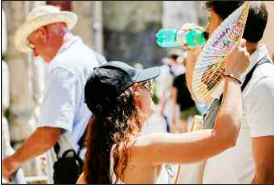
Σας έλειψε η δρασιά;