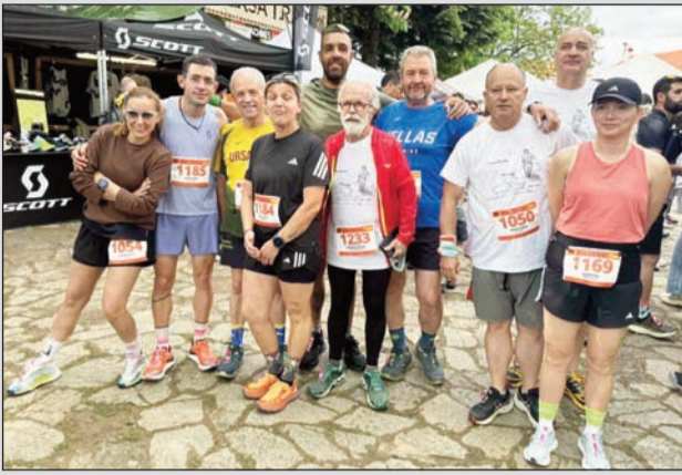
Χόρτασαν τρέξιμο τα μέλη του Συλλόγου δρομέων στα μονοπάτια της Πίνδου

Με εξαιρετικές εμφανίσεις στα μονοπάτια της Πίνδου, ο Σύλλογος Δρομέων Τρικάλων συμμετείχε το περασμένο Σαββατοκύριακο στον κορυφαίο αγώνα ορεινού τρεξίματος Ursa Trail, που πραγματοποιήθηκε στο πανέμορφο Μέτσοβο, συγκεντρώνοντας εκατοντάδες αθλητές από όλη την Ελλάδα και το εξωτερικό.