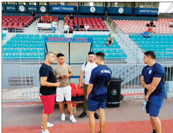
Οι πρώην... Παραγουανοί του Α.Ο Τρίκαλα έκαναν διάσημη την τρικαλινή ομάδα σε όλο τον κόσμο