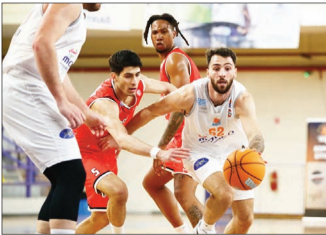
Δύσκολοι είναι οι συσχετισμοί για την επόμενη μπασκετική ημέρα

Είναι πασιφανές όμως ότι χρειάζεται κάποιος κράχτης, που θα αποτελέσει πηγή έμπνευσης για τους φιλάθλους, που θυμίζουν κοιωμένο γίγαντα. Για να ενεργοποιηθούν εκ νέου χρειάζονται το κατάλληλο ερέθισμα αλλά και καθαρές κουβέντες.