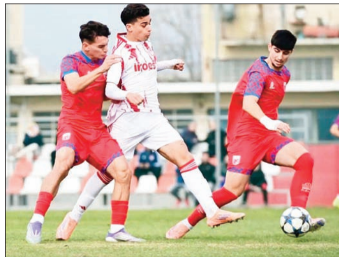
Ηγετική παρουσία του Σατρατζέμη στην Κ19 του ΝΠΣ Βόλος