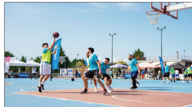
Το δικό του χρώμα θα έχει και το φετινό 3x3

Το τουρνουά θα περιλαμβάνει: Group Stage Matches, Play Offs, Finals, Pool Party.