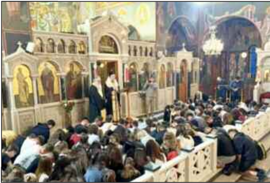
Οι ευχές ποτέ δεν πάνε χαμένες