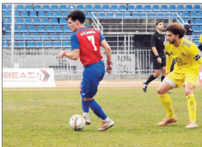
Στην τελική ευθεία βρίσκεται η προετοιμασία του νέου πρωταθλήματος Γ' Εθνικής κατηγορίας και ο ΑΟΤ παραμένει ακούνητος και... αμίλητος

Από τους 53 κυπελλούχους οι 19 ολοκλήρωσαν την σεζόν με τον καλύτερο δυνατό τρόπο, καθώς πανηγύρισαν και το «νταμπλ». Οι δύο από αυτούς είναι ο Εθνικός Πει-