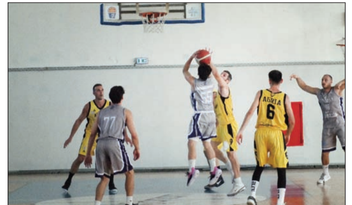
Ο συγκερασμός αγωνιστικών στοιχείων δίνει μεγάλη ώθηση στις ομάδες

Αντίθετα όποιος ψάχνεται με σχέδιο και διορατικότητα εισπράττει τον καθολικό σεβασμό