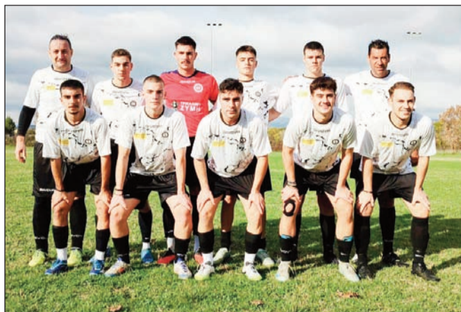
για τη «ΦΛΟΓΑ» Με αφορμή τις δυνάμεις μας για τα παιδιά αυτόν τον αγώνα, ενώνουμε που δίνουν τον δικό τους, κα-

Όμως, η μεγαλύτερη νίκη για εμάς είναι η προσφορά στον συνάνθρωπο. Αυτό το παιχνίδι δεν είναι απλά μια γιορτή τίτλων, αλλά μια αγαλιά ελπίδας. Σκοράρουμε