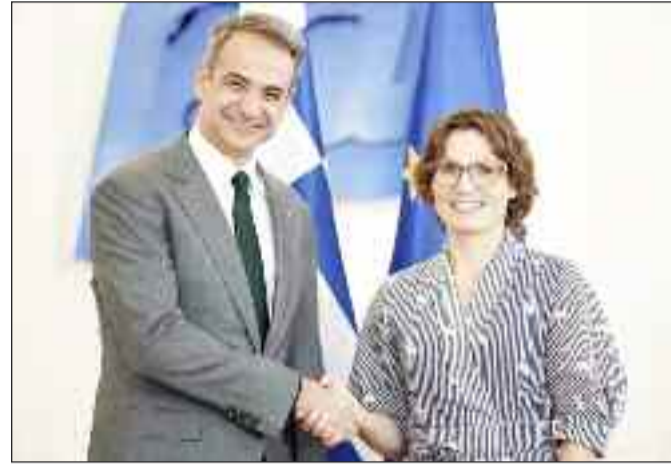
Ο πρωθυπουργός έδωσε ιδιαίτερη έμφαση στο σχέδιο που ακολουθεί η Ελλάδα για την πρόληψη και την πρό-

Κατά τη διάρκεια της συνάντησης στο Μέγαρο Μαξίμου συζητήθηκαν ζητήματα του χαρτοφυλακίου της και Roswall, με έμφαση στην Ευρωπαϊκή Στρατηγική για την Ανθεκτικότητα των Υδάτων, την προστασία της θαλάσσιας βιοποικιλότητας και την ευρωπαϊκή στρατηγική για την αντιμετώπιση πυρκαγιών.