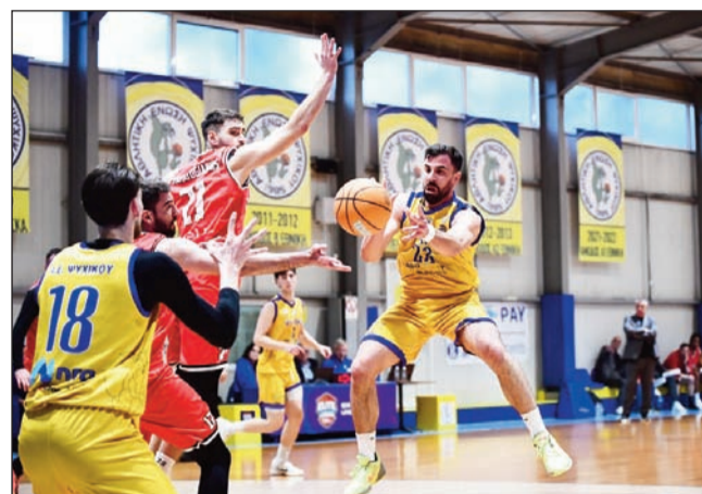
Τα εθνικά πρωταθλήματα προσφέρουν παραδοσιακά πλούσιο υλικό

Από την άλλη τμήματα μπήκαν στην μάχη με φόρα και